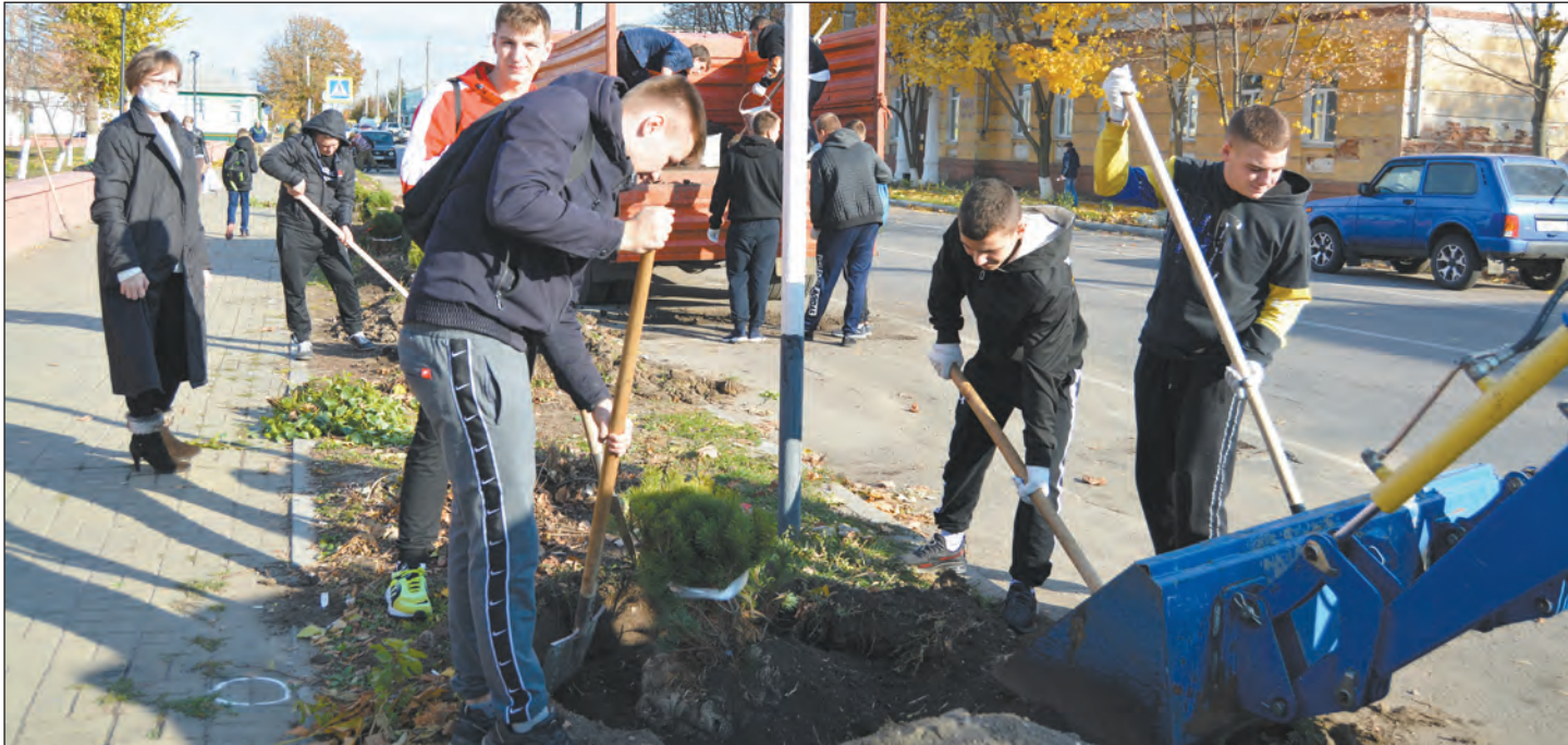
Студенты Богучарского многопрофильного колледжа активно участвовали в посадке деревьев

Невысокие деревья с широкой кроной станут украшением Богучара