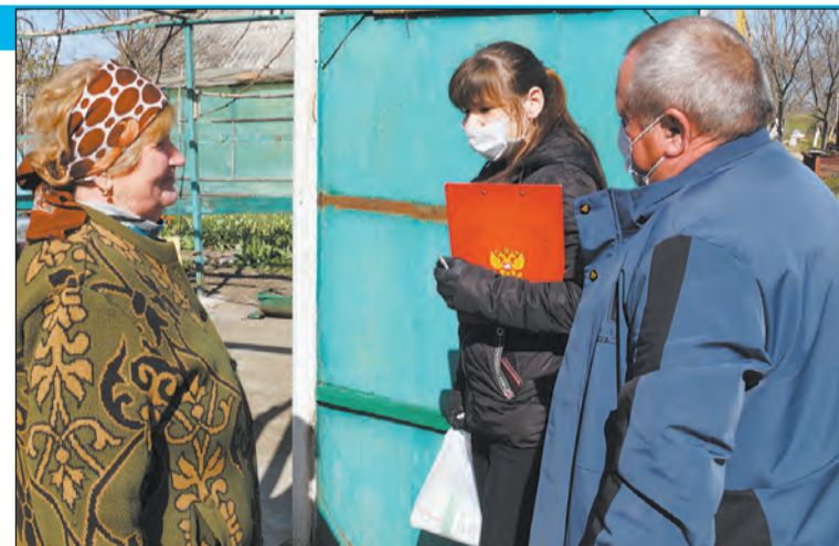
■ Продуктовые наборы поступили вовремя