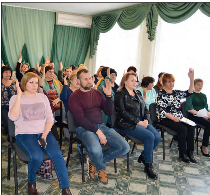
■ Деlegates конференции активно вносили свои предложения

При инициативном бюджетировании жители непосредственно участвуют в определении важнейших проблем местного значения. В дальнейшем, когда средства получены, горожане подключаются к общественному контролю по реализации проекта. По выбору населения муниципального образования может осуществляться не более одного проекта в год. Благодаря реализации таких проектов мы способствуем развитию нашей Малой Родины и обустройству городских территорий.