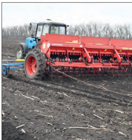
■ Луговские полеводы ведут сев яровых культур

рабочей смены. Планировалось, что со следующего дня они приступят к севу ячменя. Однако планы данцевских полеводов нарушила непогода.