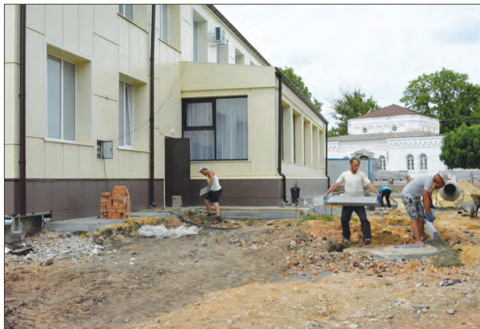
До конца июня будет завершено благоустройство прилегающей к РДК территории