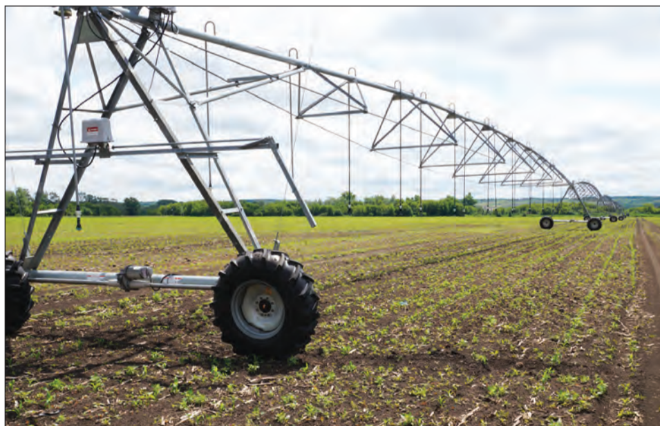
Одна из круговых дождевальных установок