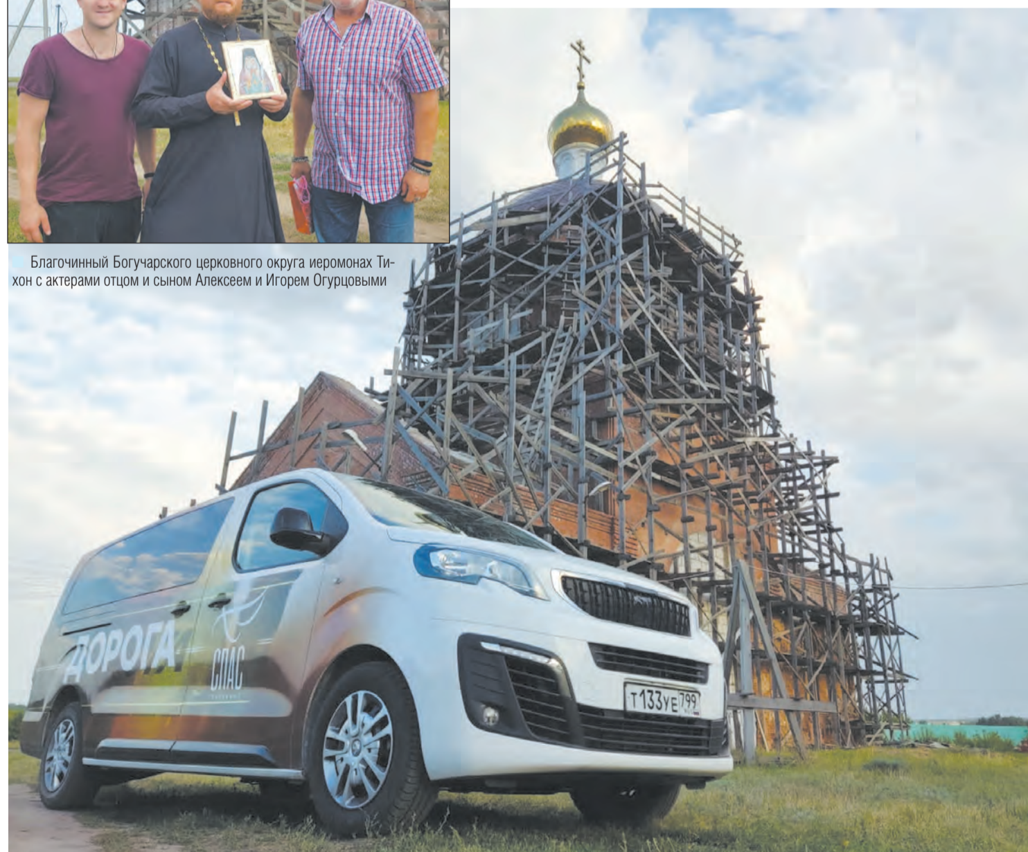
Съемки проходили у восстанавливаемого храма

Программу можно будет посмотреть в октябре этого года