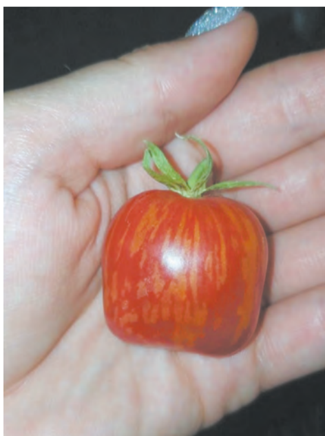
Помидор сорта «Тигренок»

Наталья ЛИФИНЦЕВА