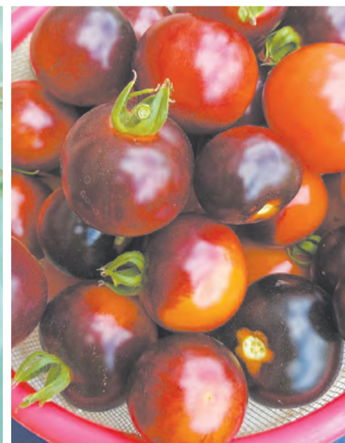
Помидоры «Жар угли»