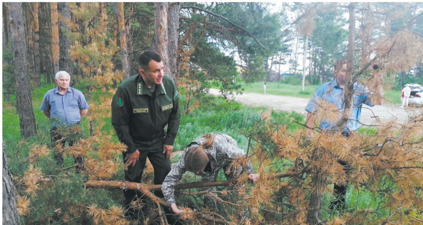
■ Массовое усыхание деревьев было зафиксировано сразу в нескольких лесничествах

Почему болеют хвойные леса и чем это грозит Воронежской области