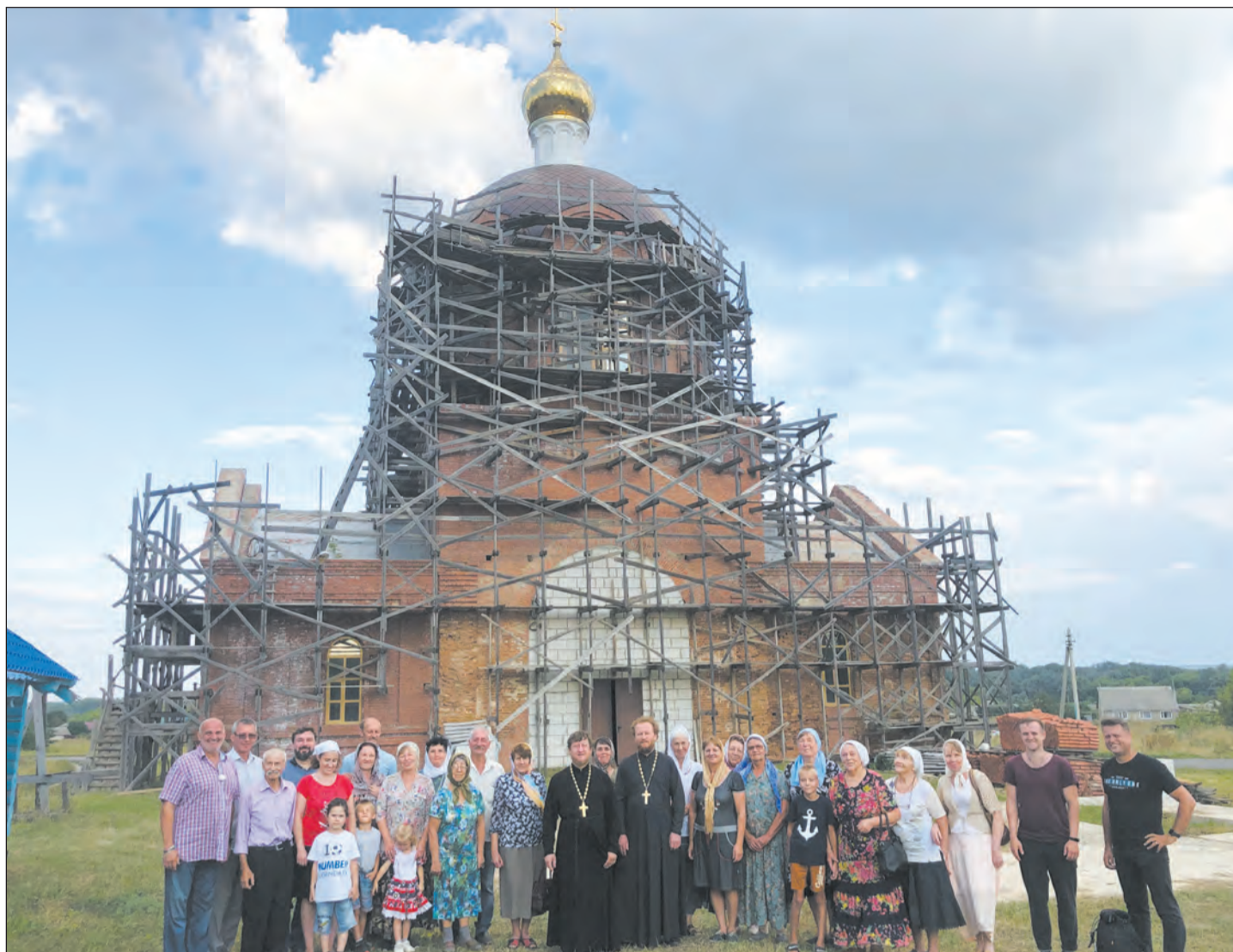
Столичные гости и жители нашего района, которые поучаствовали в съемках