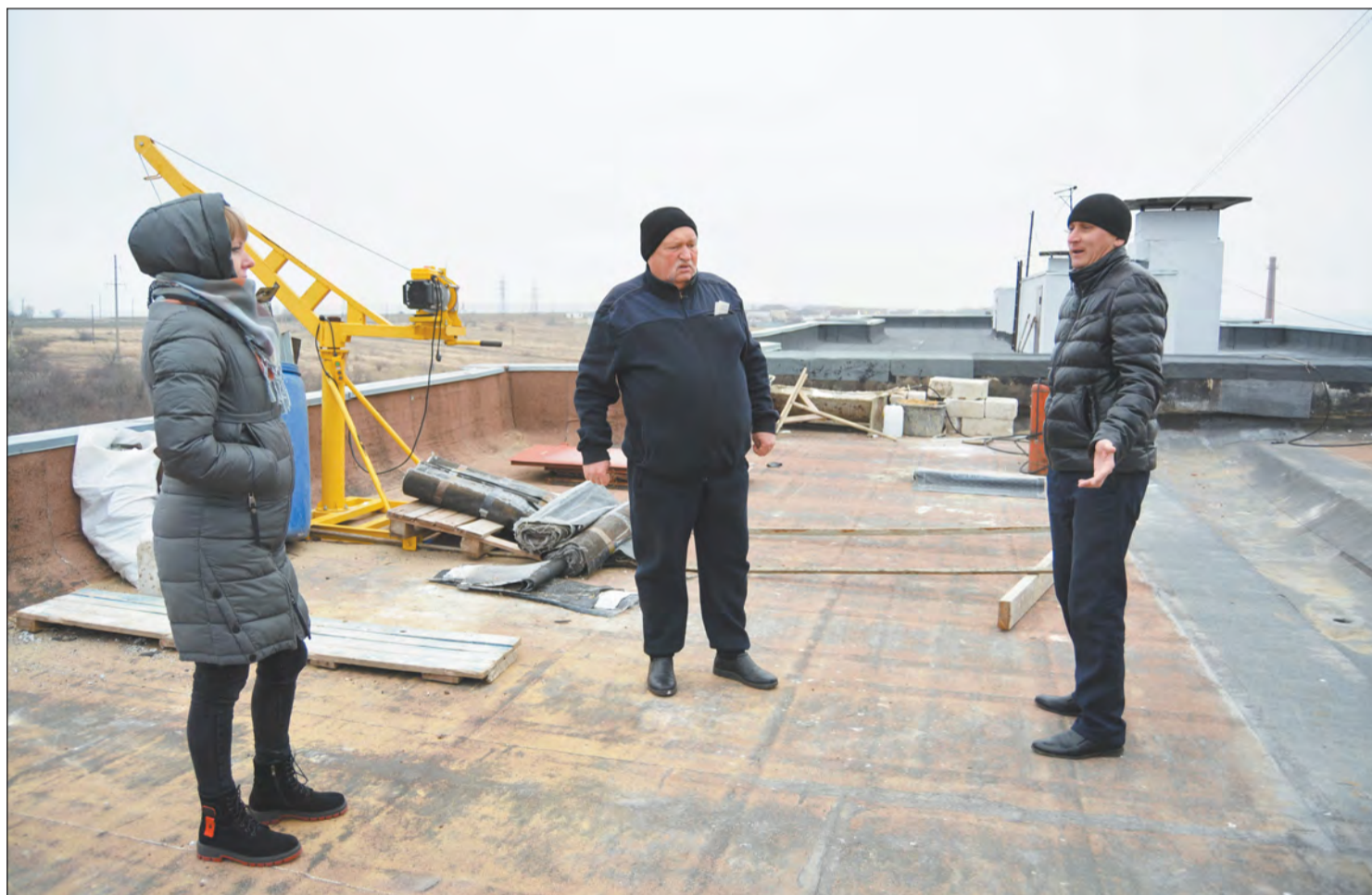
Представители городской власти и собственники помещений пятиэтажного дома на пр-те 50-летия Победы обсудили дальнейшую судьбу капитального ремонта кровли

Подрядчик сорвал сроки производства работ на двух объектах в Богучаре