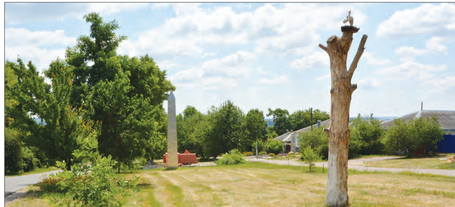
Одна из центральных улиц Богучара скоро станет еще краше