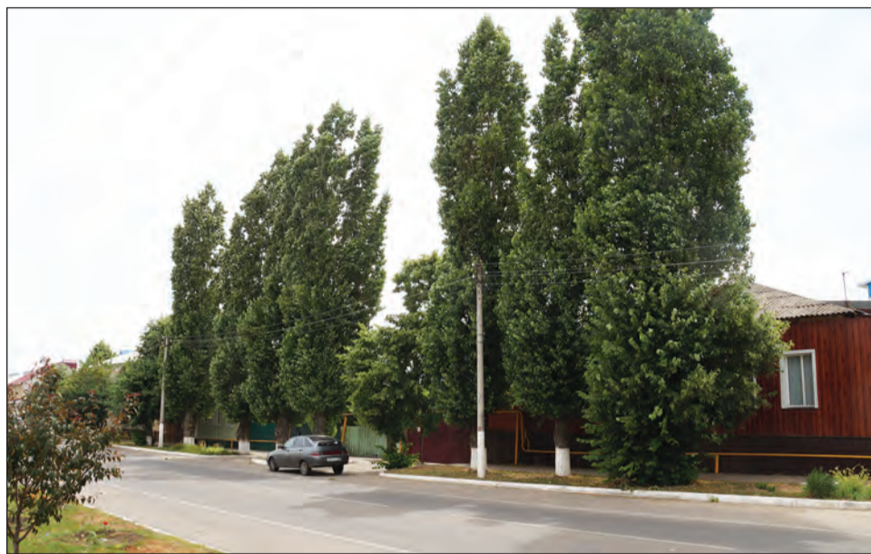
Тополя на улице 25 Октября возвращают на полвека назад