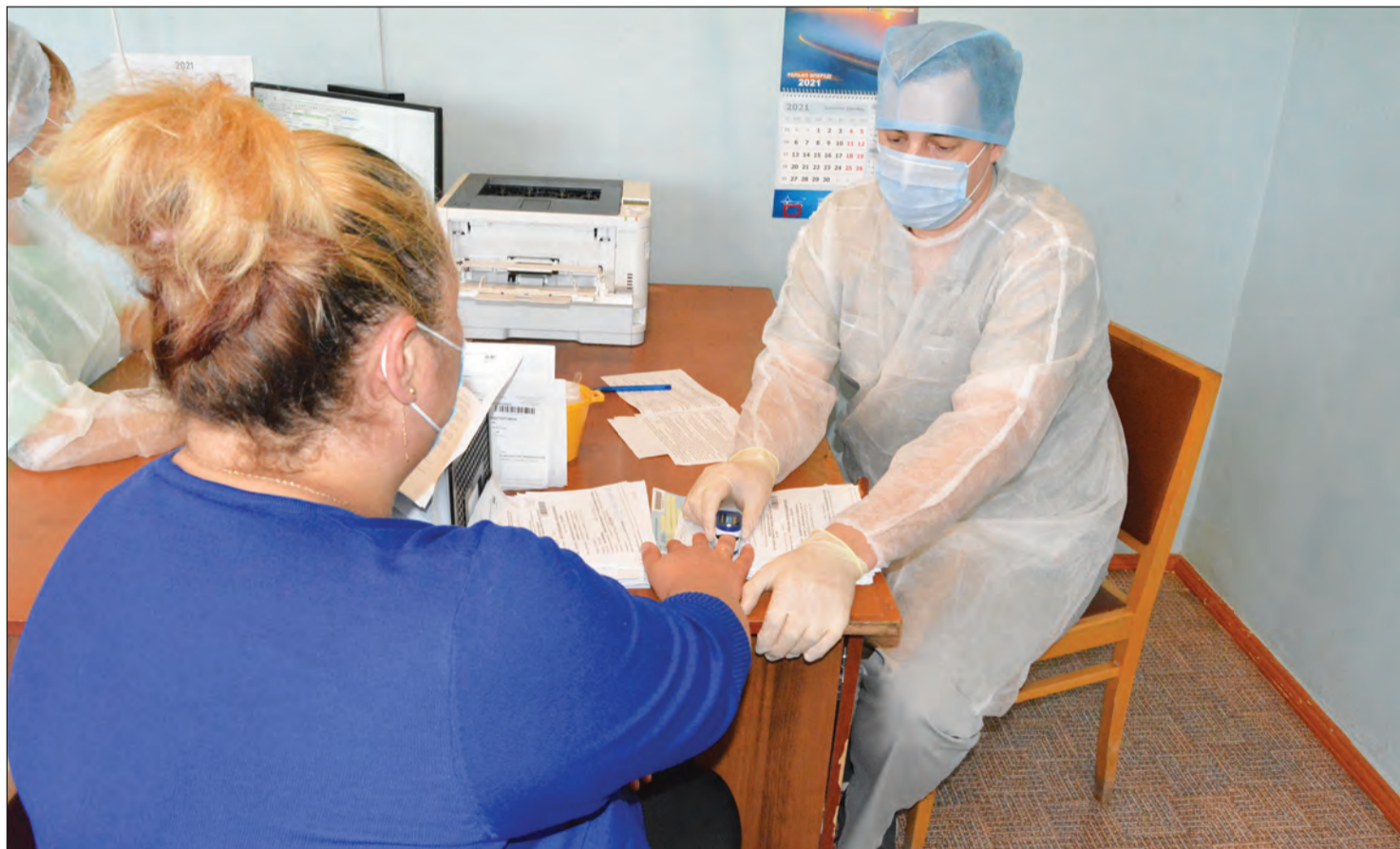
При лечении коронавируса важно ориентироваться на сатурацию

За весь 2020 год было зафиксировано 16 летальных исходов