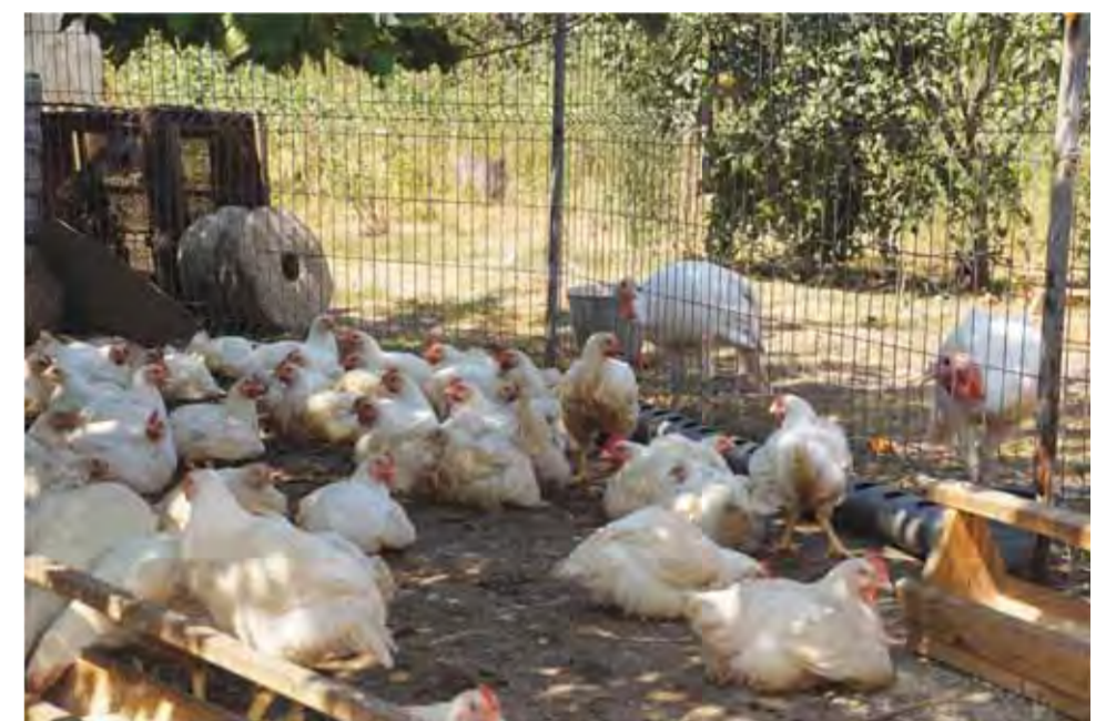
Места, где содержится птица, должны быть ограждены сеткой

Владимир ГЕРУСОВ