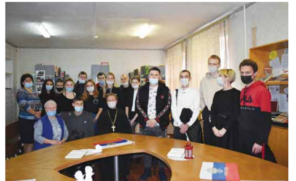
Участники круглого стола

В рамках проекта «Европейская неделя местной демократии» в Богучаре на базе многопрофильного колледжа состоялся круглый стол «Общие принципы местного самоуправления, наш дом – наша забота», а также информационная акция «Право имеет каждый». Организаторы мероприятий – администрация города Богучар, Богучарское благочиние, а также городской Совет депутатов.