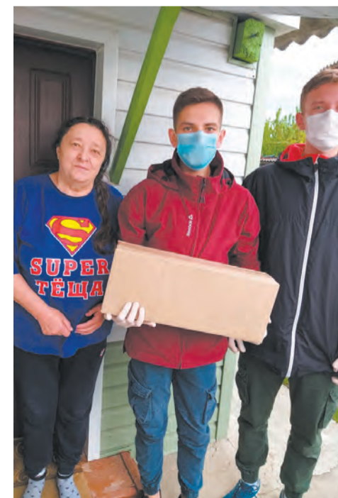
Студенты колледжа тоже поучаствовали в акции

Наталья ЛИФИНЦЕВА