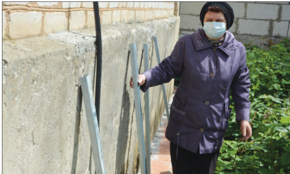
Пострадавшая пенсионерка показала работу «строителей»

Семья пожилых людей отдала нечистым на руку строителям 39 тысяч рублей