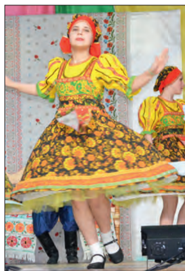
■ На сцене — воспитанники ДШИ