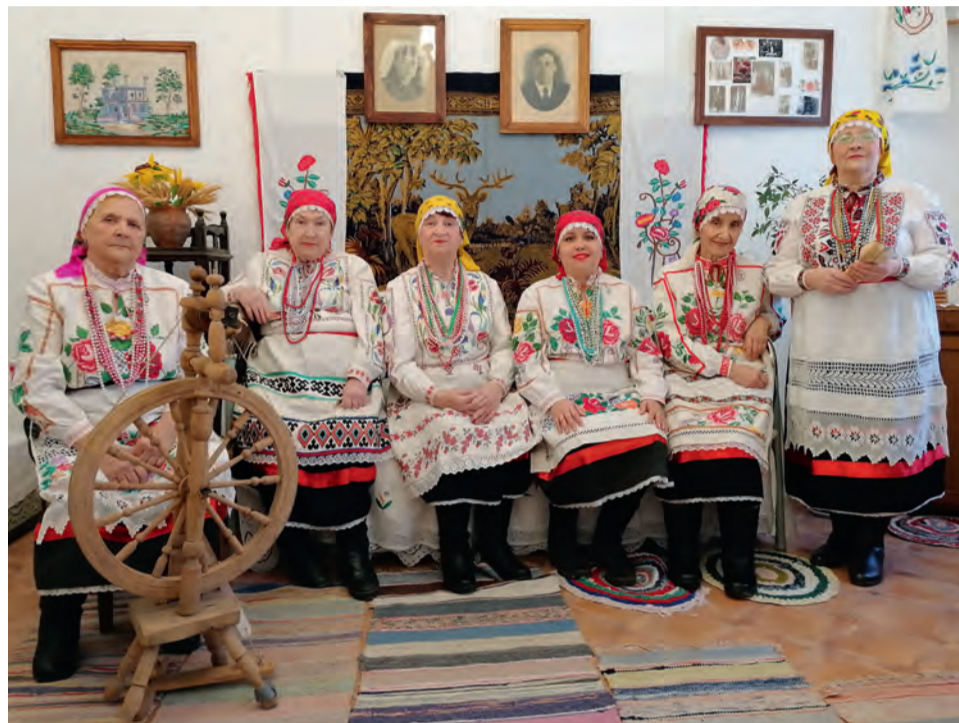
■ Ансамбль «Черешенка» ДК ветеранов — лауреаты межрегионального фестиваля «Песни над Доном»

— Участвовать в дистанционном конкурсе — задача непростая. Это огромная ответственность для конкурсантов, показывающих мастерство исполнения, а так-