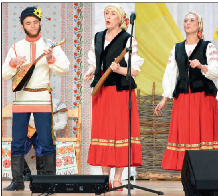
■ На мероприятии состоялся дебют ансамбля «Наследие»

На мероприятии богучарцы выразили свою поддержку жителям Донбасса в их борьбе за свободу и независимость. Завершился концерт общей песней, во время которой все выступающие вышли на сцену с флагами Российской Федерации и воздушными шарами цвета триколора.