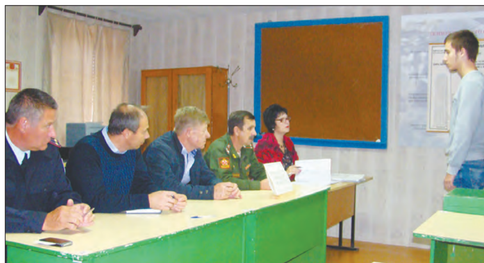
Идет работа допризывной комиссии

– Хотелось бы успокоить родных и близких призывников, общественность района – все плановые мероприятия, связанные с призывом и отправкой молодых богучарцев в войска, будут проведены в установленном порядке и в сроки, скорректированные с учетом выполнения мер, направленных на предотвращение распространения коронавирусной инфекции. Во время всей призывной кампании в военном комиссариате Воронежской области будет работать телефон «горячей линии» 8 (473) 252-53-30, в военном комиссариате Богучарского района 8 (47366) 2-16-07. По этим телефонам можно будет узнать информацию, имеющую отношение к тому, как проходит призыв. В том числе узнать и о том, что делается для того, чтобы не допустить случаев заболевания коронавирусной инфекцией как