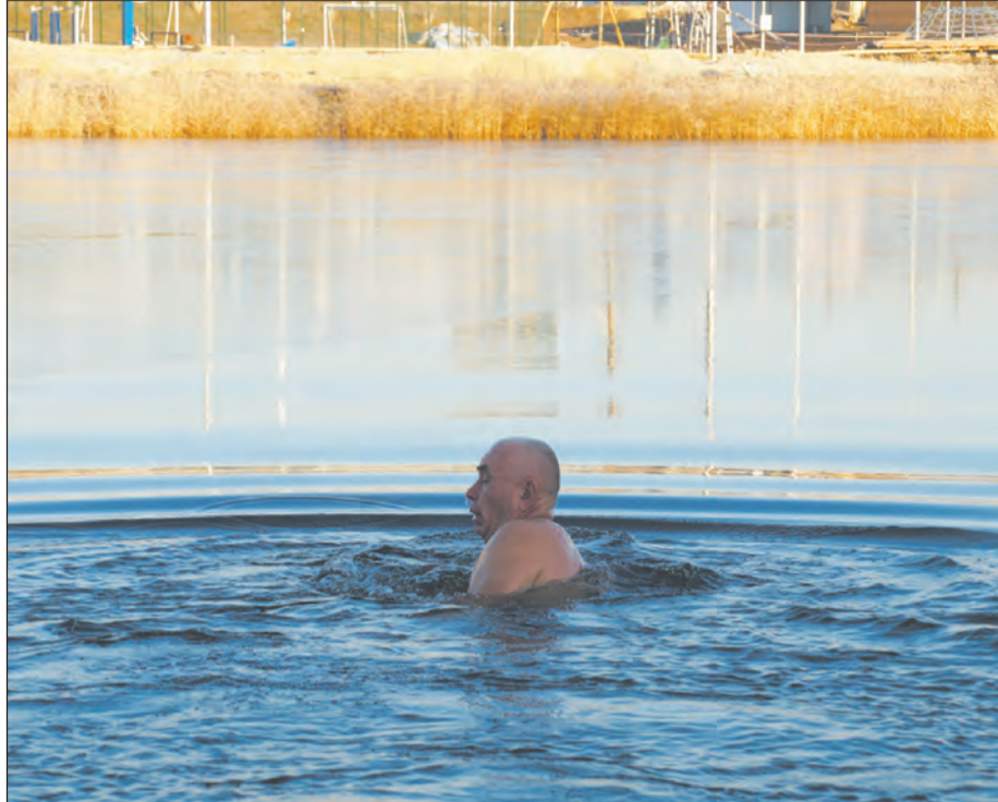
Плавание в ледяной воде доставляет непередаваемое ощущение

С тех пор каждый год, начиная с конца ноября и до завершения ледостава на Богучарке, он практически ежедневно дважды в день появляется на реке. Благо, что она находится в нескольких десятках метрах от дома. Поэтому в лю-