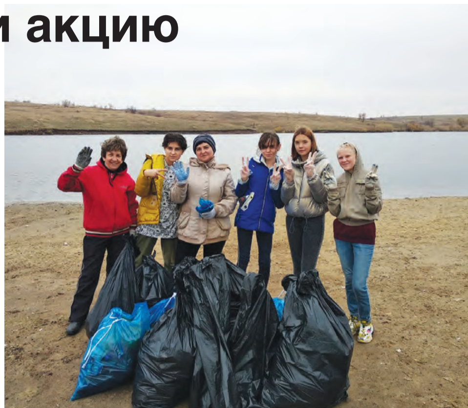
Участники акции собрали несколько 120-литровых мешков мусора