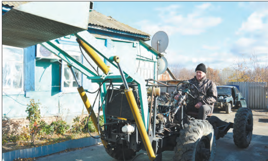
Погрузчик народный умелец смастерил за одно лето