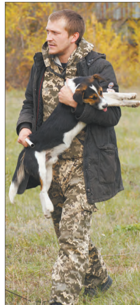
Отловили еще одну бродяжку

В целом люди к практике отлова безнадзорных животных относятся с пониманием, в том числе и в нашем районе. Ведь хаотично передвигающиеся