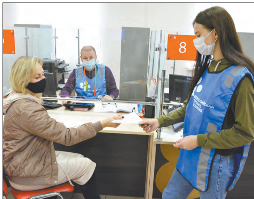
Интернет-перепись можно пройти и в МФЦ

– По экипировке. На каждом должен быть светоотражающий жилет и фирменный шарф с логотипом Всероссийской переписи населения, переписная сумка, планшет, а также удостоверение, действительное при предъявлении паспорта. Отмечу, что каждый переписчик прежде чем приступить к работе, прошел обучение.