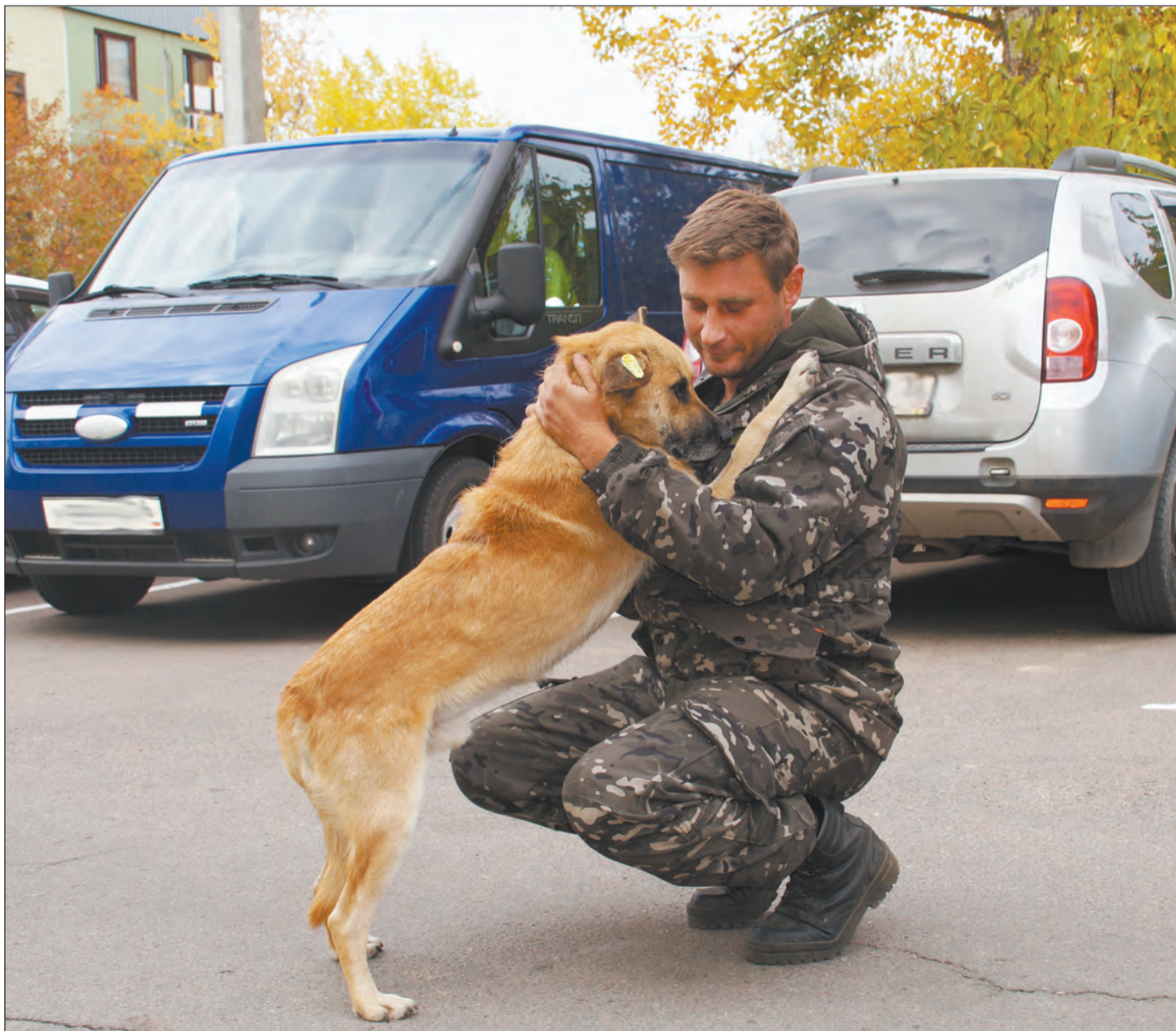
Сотрудник приюта выпускает животное на свободу

В район из Воронежа доставили 12 стерилизованных животных