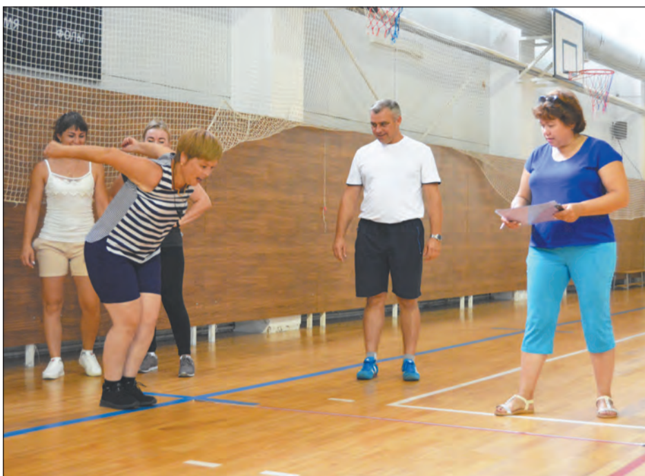
■ Не так-то легко выполнять прыжок с места

Специалисты отдела образования проверили свою физическую форму