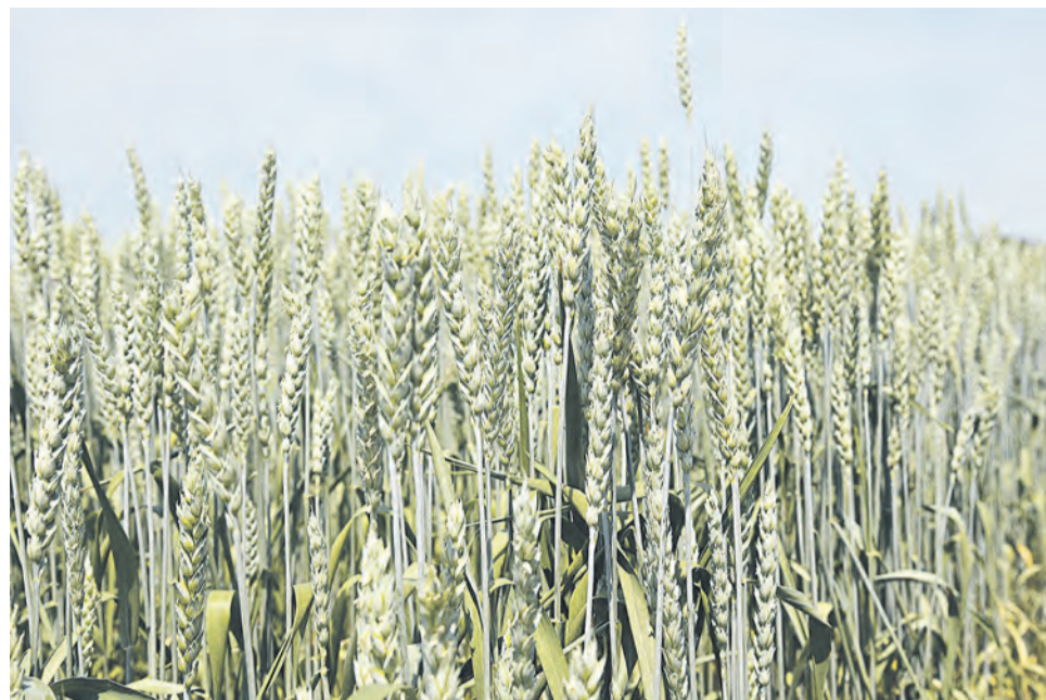
Применяя «твердую воду», можно добиться повышения урожайности сельхозкультур

Конкуренция среди производителей гидрогелей высокая, лидировать непросто. Химики из ВГУ усовершенствовали свою разработку и создали «твердую воду» со свойством биodeградируемости.