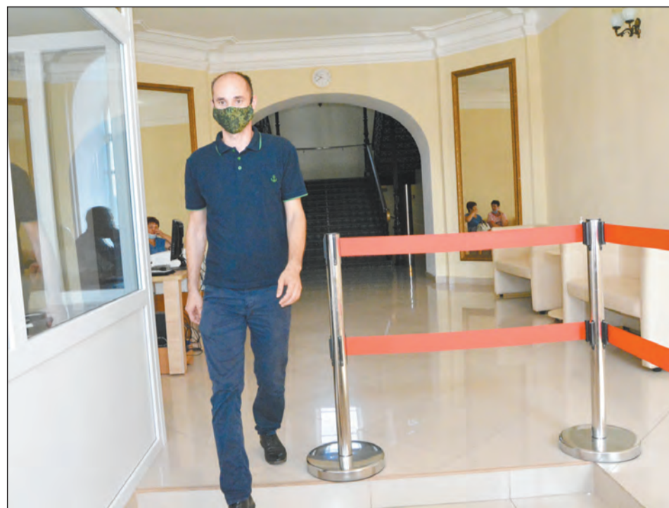
Многие богучарцы исправно следуют рекомендациям

– Некоторые люди относятся агрессивно к таким мерам, есть те, которые, посмотревшись роликов в интернете, начинают рассказывать о своих правах и обязанностях. Но в основном люди признают свою вину, объясняют, что, к примеру, забыли маску дома, – говорит заместитель начальника полиции по охра-