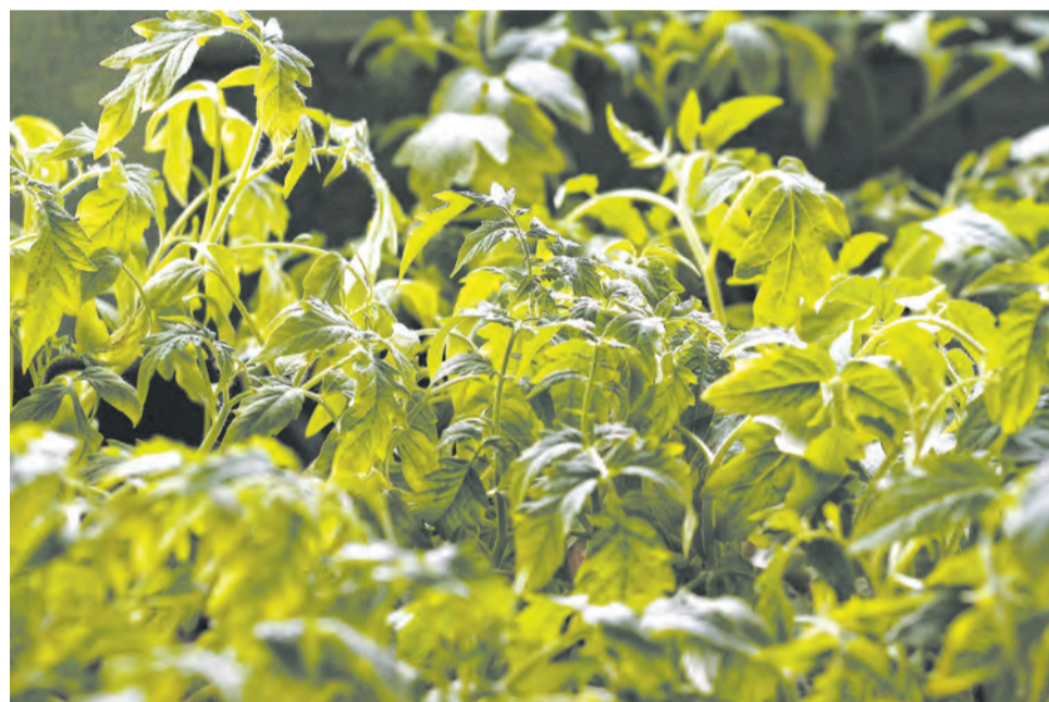
Гидрогель можно использовать при выращивании томатов