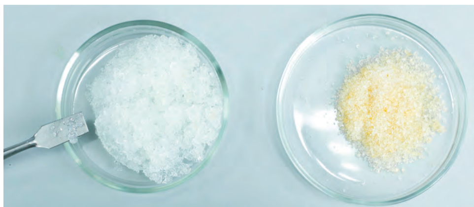
Лабораторные исследования показывают правильность выбранного пути

Чем чище вода, тем больше полимер может ее вобрать. Один килограмм вещества впитывает 400–500 л дистиллированной воды и 300–350 л водопроводной. Дождевая вода сама по себе достаточно чистая, но, попадая в почву, она обогащается солями, и килограмм полимера впитает в себя лишь до 200 л в зависимости от содержания солей в почве.