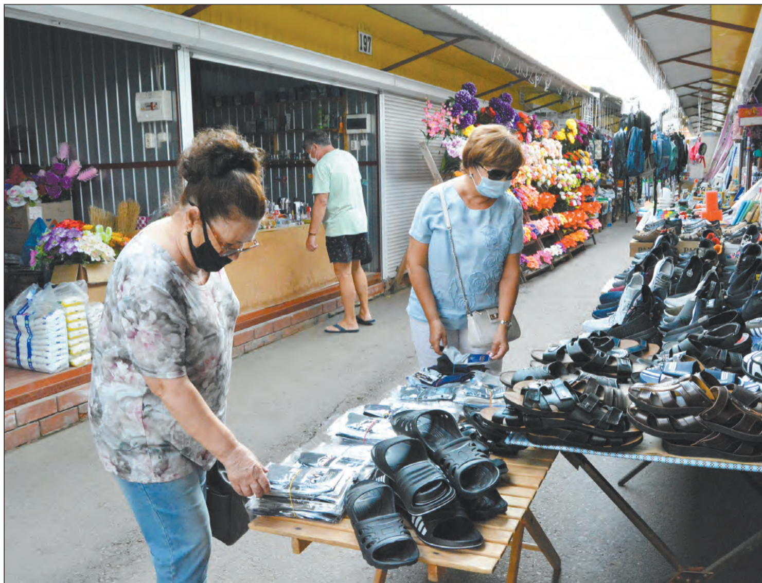
Вход на рынок Богучара разрешен только в масках

В основном нарушители были замечены в магазинах и общественном транспорте