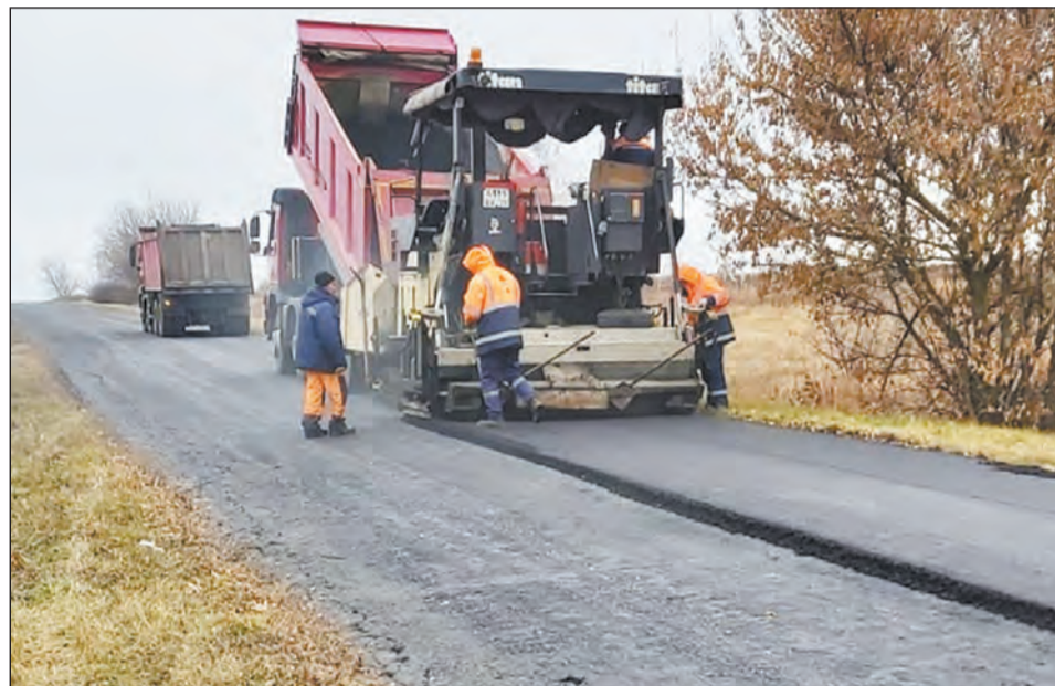
Дорожные рабочие укладывают асфальт на сельской дороге

Дорожники каждый раз обещали, что как только они завершат работы по доставке песка, сразу проведут капитальный дорожный ремонт.