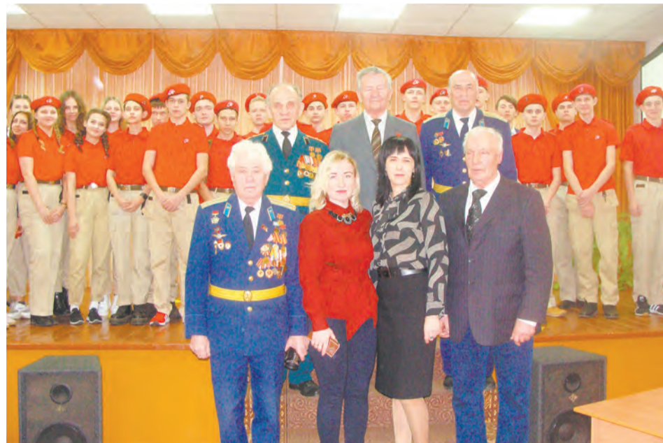
Фото на память с воронежскими гостями

Воронежские гости поучаствовали в митингах в центральном парке города Богучара и села Радченское. Собранные почтили память погибших в Великой Отечественной войне, пожелали друг другу здоровья и мирного неба над головой. А еще они посетили литературно-концертные программы, подготовленные молодежью этих населенных пунктов. Юноши и девушки зачитывали отрывки из книги «Ровесники», пели военно-патриотические песни, общались с гостями о пережитом ими непросто