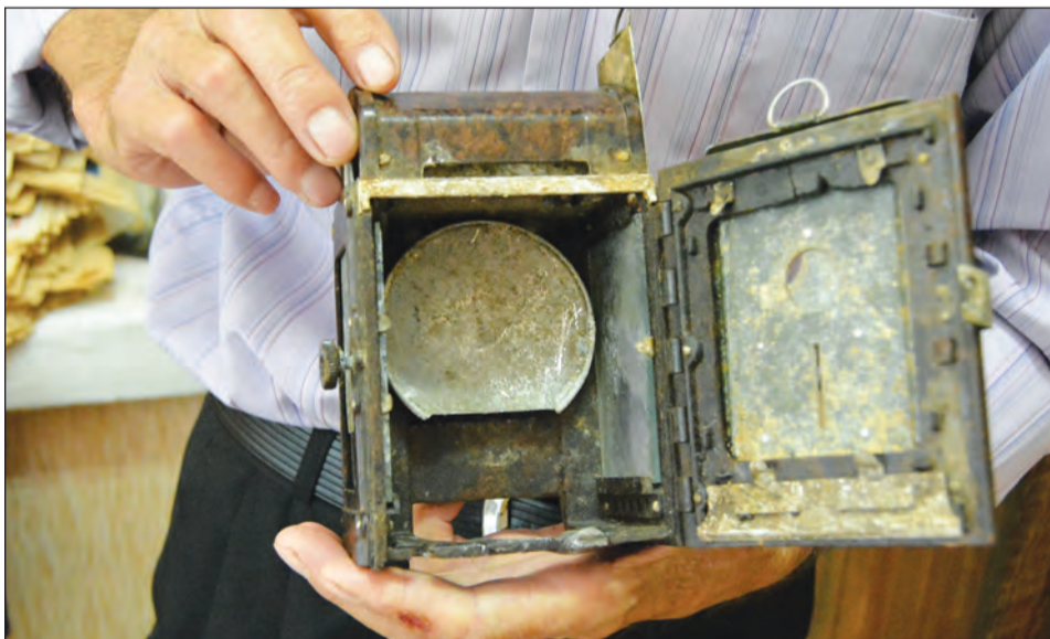
Так выглядит внутри фонарь, найденный на «Шестом поле»

Еще один фонарь обнаружили при въезде в село Дубовиково в немецком блиндаже. Поисковики выяснили, что это карбидная лампа.