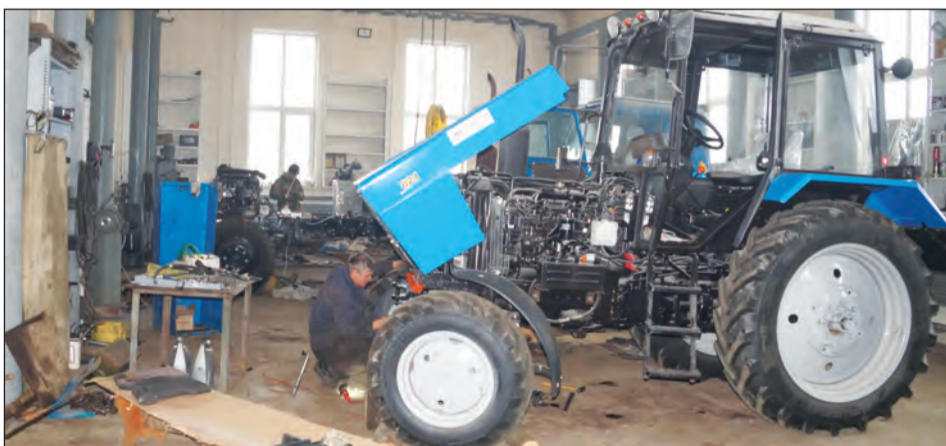
Идет подготовка колесной техники к предстоящей операции «Трактор»

Он также напомнил, что водители и трактористы, когда выезжают на линию, должны при себе иметь удостоверение на право управления транспортным средством, свидетельство о регистрации на машину, свидетельство о прохождении технического осмотра, страховой полис