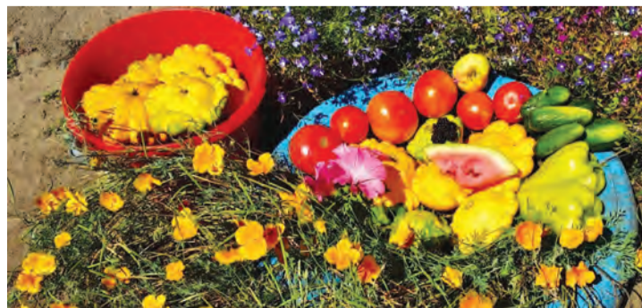
Урожай с огорода жительницы Галиевки Валентины Бондаренко

Уважаемые читатели, предлагаем вам поделиться фотографиями уникальных овощей или фруктов, выращенных на вашем приусадебном участке в 2020 году. Приветствуются снимки, на которых будет запечатлен вместе с урожаем и человек, благодаря заботливым рукам которого он выращен. Фотографии добавляйте в альбом «Дары природы» в группах «СН» в соцсетях «Одноклассники» и «ВКонтакте».