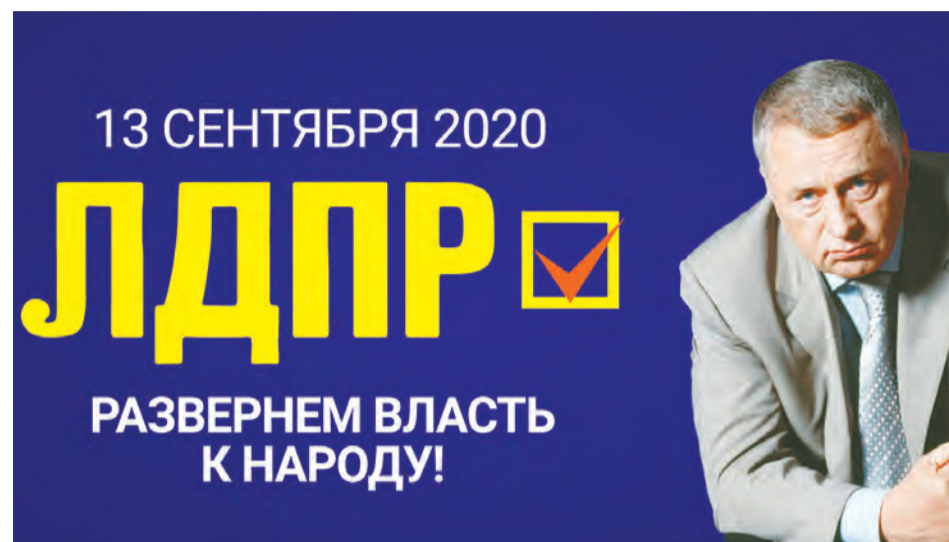
Схема пенсионной реформы должна быть простой: выплачивать по тысяче рублей за каждый год пенсионного стажа. 20 лет отработал — государство обязано выплачивать 20 тысяч рублей, 30 лет — тридцать тысяч рублей. А современная пенсионная реформа ущемляет интересы наших граждан, покрывая результаты деятельности Пенсионного фонда и мошеннические операции с его средствами. Поэтому ЛДПР против неё!

рают спокойную старость. Им придётся дольше оставаться на работе, провоцируя подобной нагрузкой болезни и скандалы в семьях. Их лишают возможности побыть с внуками, съездить на дачу, пообщаться со сверстниками в спокойной обстановке.