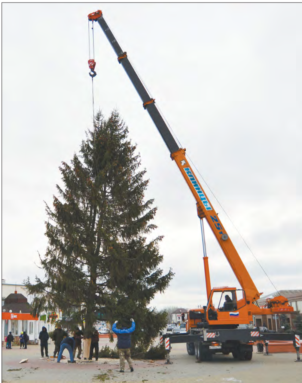
Главную елку района установили на площади Малаховского