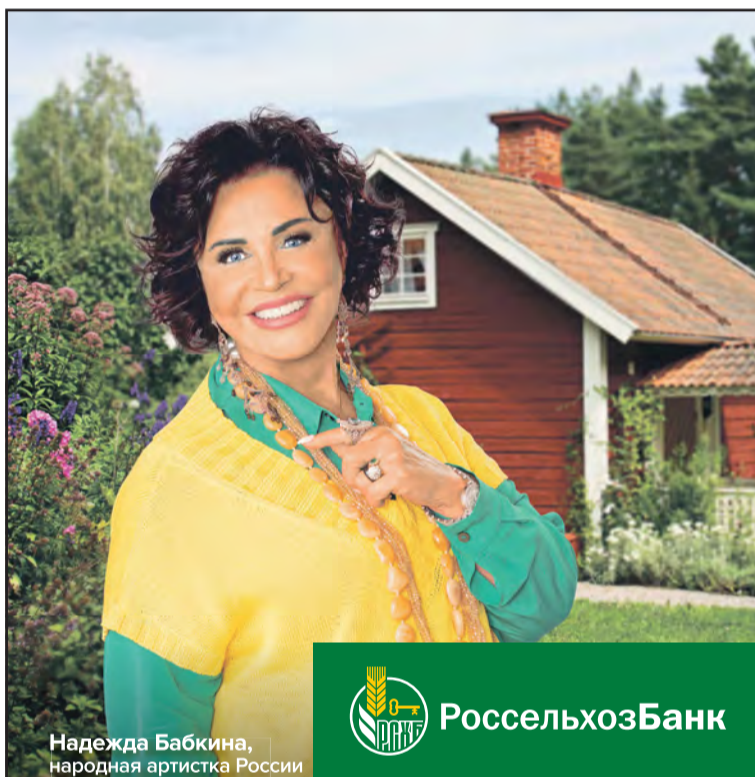
Надежда Бабкина, народная артистка России