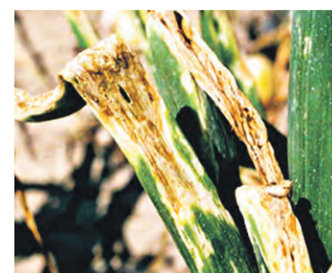
Отмирание верхушек листьев

Патоген переносится в пределах поля и между полями с поливной водой при дождевании и поливе по бороздам, а также с растительными остатками на оборудовании для обработки полей. Частые дожди и верховой полив могут спровоцировать вспышки заболевания. Бактерия вы-