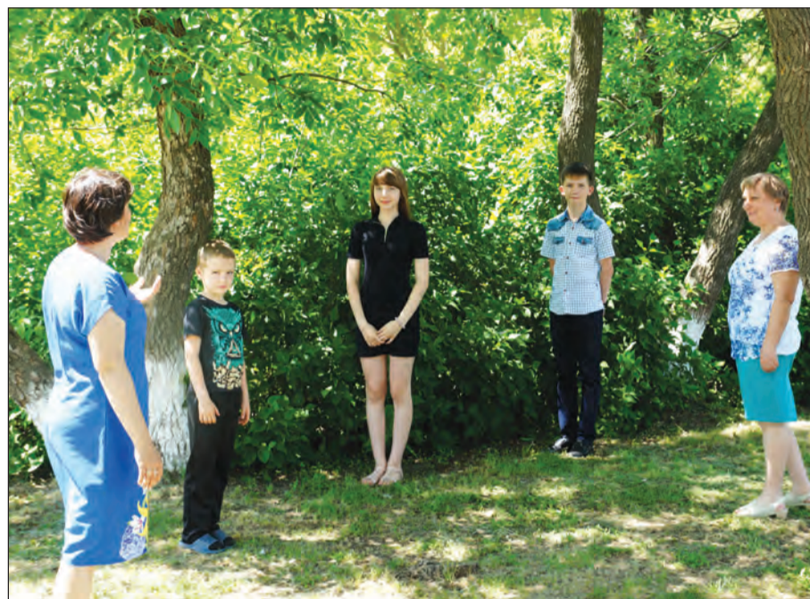
При подведении итогов проекта расстояние между участниками было не менее 1,5 метра

Учащиеся старших классов посмотрели лучшие работы областного конкурса электронных презентаций «Великая Победа Великого Народа», подготовили материалы о пионерах