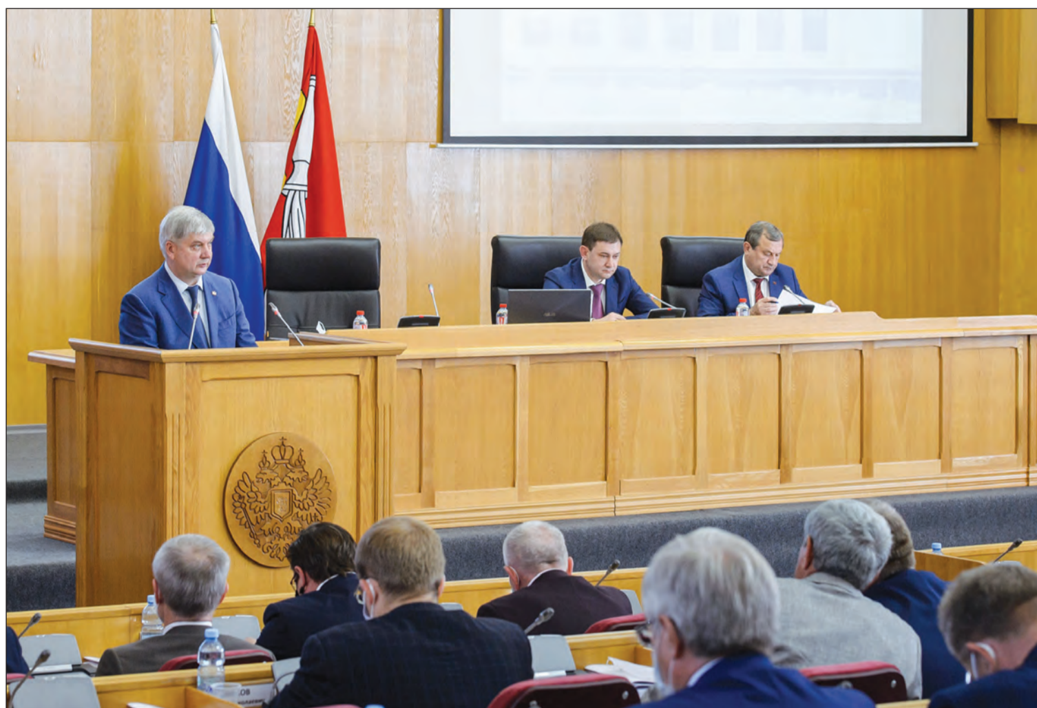
Александр Гусев по время отчета перед депутатами областной Думы

Губернатор Воронежской области подчеркнул, что бюджет социально направленный – 64% от общего количества средств потратили на здравоохранение, образование, культуру, социальную защиту и спорт.