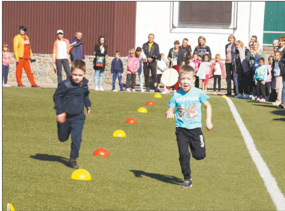
■ Бег на 30 м был самым динамичным видом состязаний