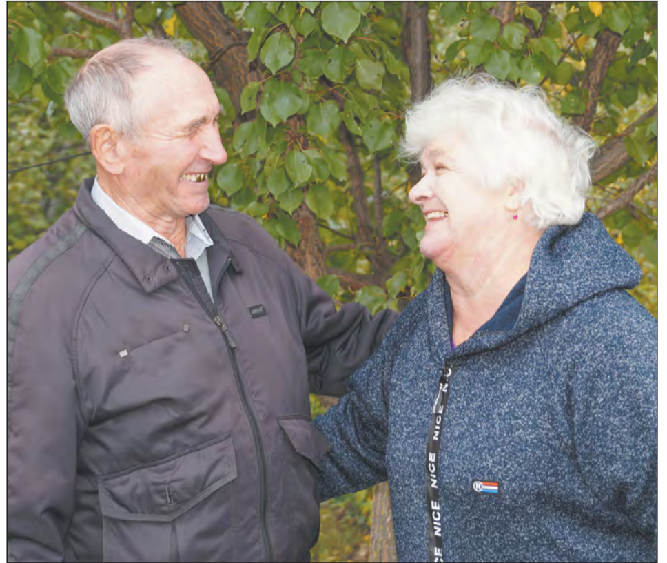
И спустя пятьдесят лет супруги не перестали улыбаться друг другу