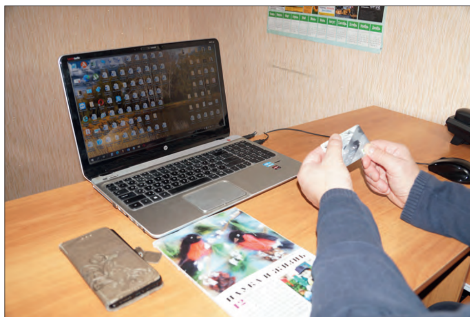
■ Примерно так выглядит рабочее место интернет-мошенника