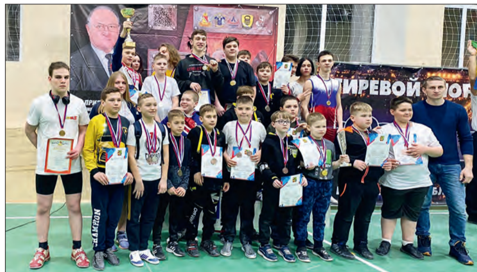
Команда богучарских гиревиков с наградами