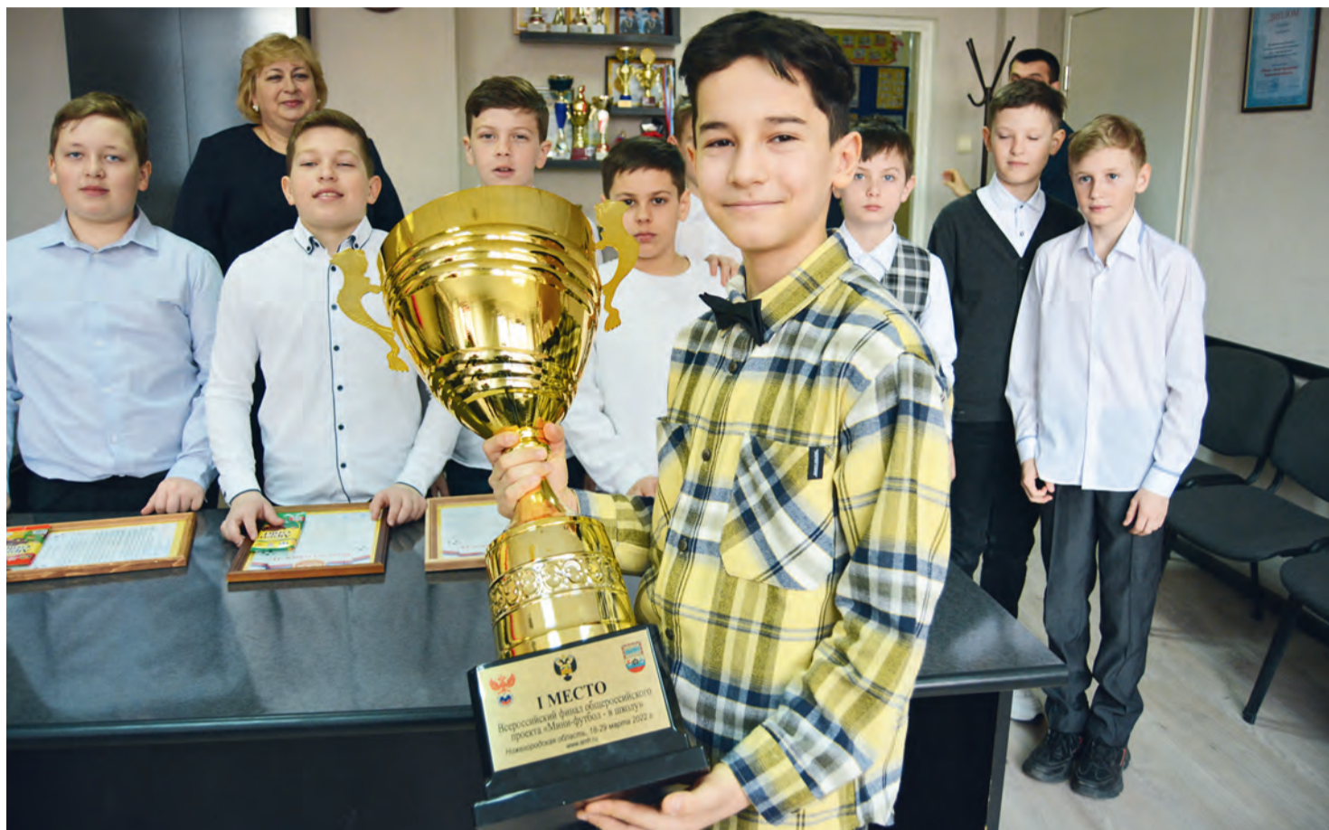
Школьной команде-победительнице был устроен теплый прием в кабинете директора

Четырехдневное пребывание наших юных спортсменов в одном из центров Поволжья не ограничивалось только фут-