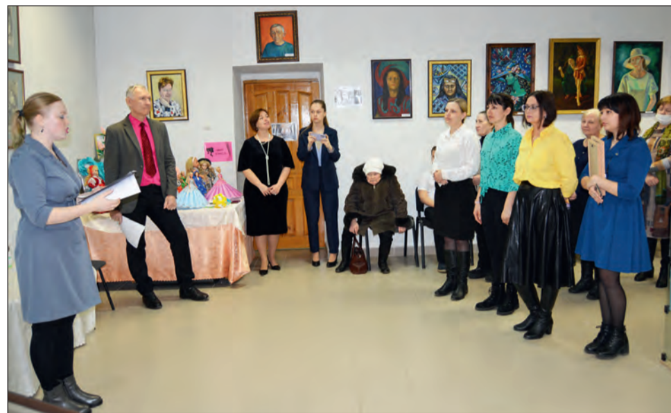
■ Выставку посетили богучарцы разных возрастов

В Богучаре открылась художественно-литературная выставка в честь Ивана Никитина