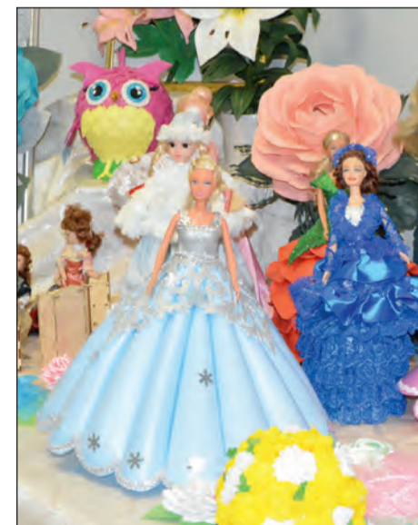
■ Все куклы в праздничных нарядах