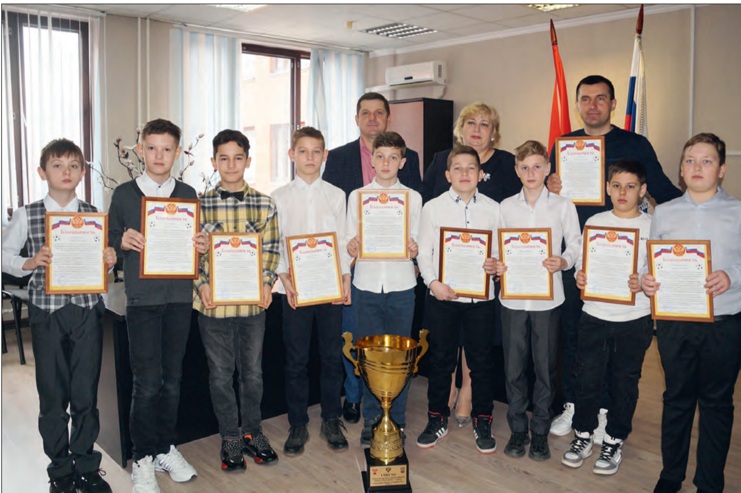
Впридачу к кубку – благодарности от администрации школы

В соревнованиях участвовали школьные команды из 40 регионов страны