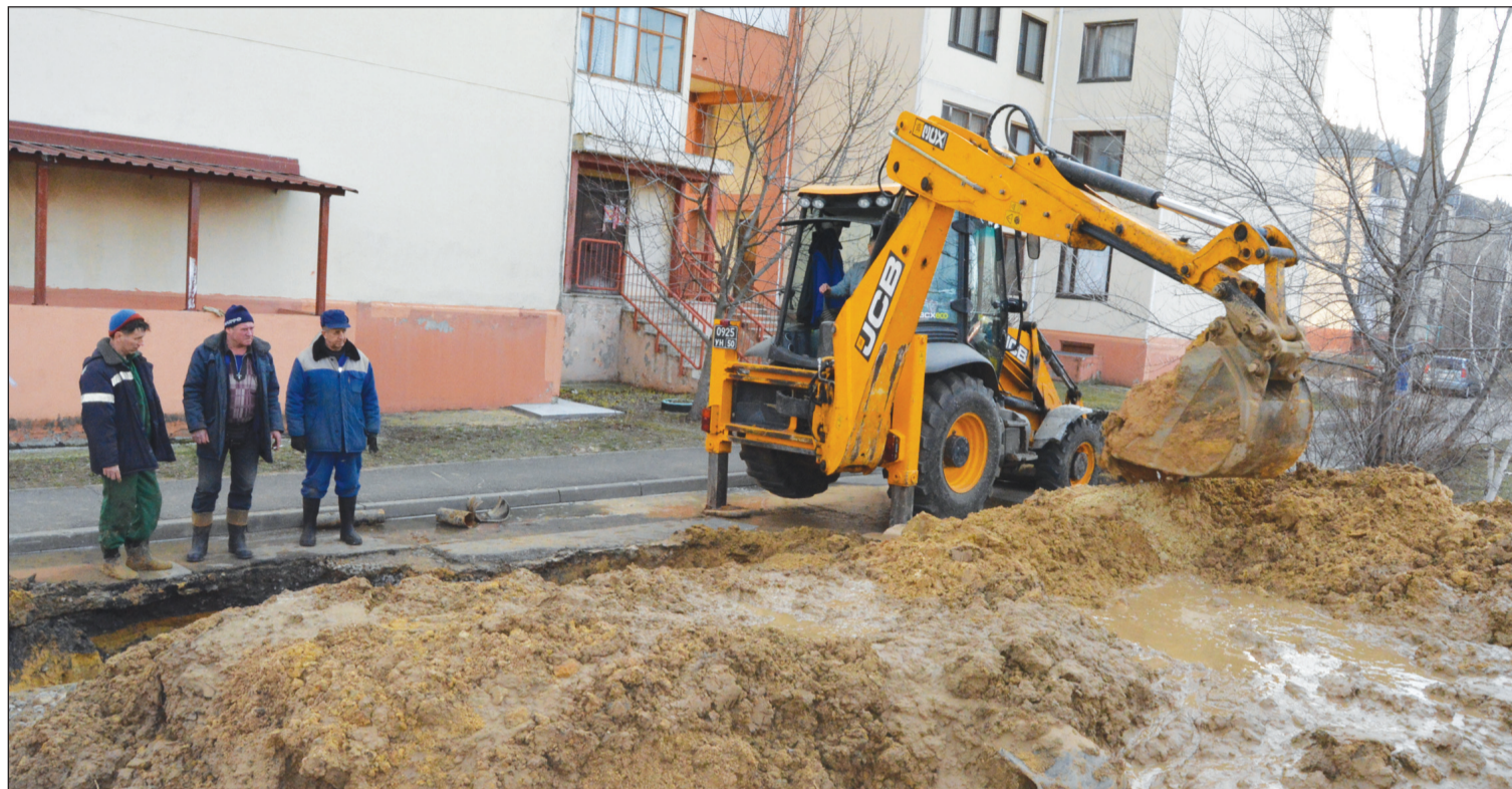
Этой весной водопровод в военном городке порвался в нескольких местах