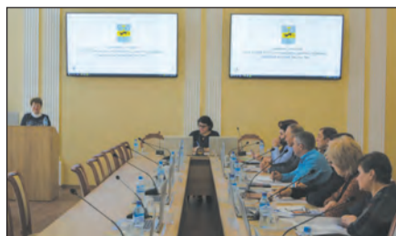
■ Были рассмотрены многие вопросы

На очередном заседании районного организационного комитета «Победа» обсудили подготовку мероприятий по проведению в районе празднования 75-й годовщины Победы в Великой Отечественной войне. В их числе – участие молодежных общественных объединений, в том числе волонтерских в церемониях захоронения останков погибших воинов, а также обследования условий жизни ветеранов войны.