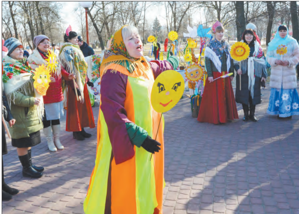
■ Первыми гостей праздника встречали коллективы детских садов

Сотрудники районного Дома культуры продолжили развлекать гостей праздника театрализованной постановкой и песнями. Началось все с угощений горячими блинами, которые разносили нарядные юноши и девушки. А затем на сцене у РДК была показана юмористическая сценка о том, как Баба Яга препятствовала приходу весны, но, испугавшись зимней выюги, сдалась. Завершилось представление огромным хороводом с участи-