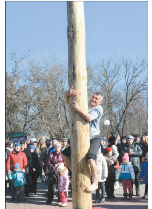
■ 13-метровый столб покорили единицы

Ну а самые смелые представители сильного пола отважились влезть за подарком на 13-метровый масленичный