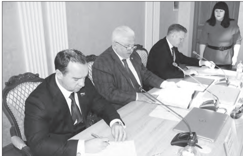
Участники соглашения скрепили подписями взаимные обязательства