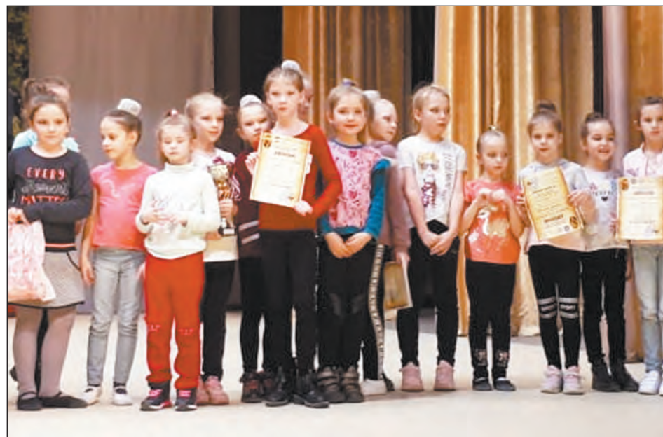
Юные артисты после церемонии награждения

Дипломами лауреатов II степени отметили танцы «Веселые кисточки» (номинация «Эстрадный танец»), «Дымковская