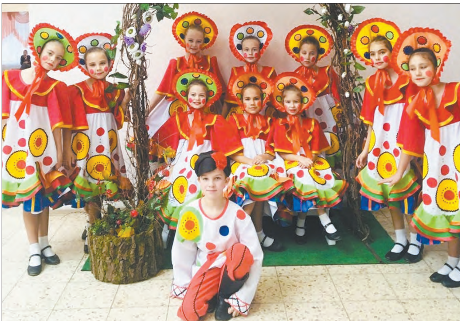
На фото – одни из призеров конкурса, исполнившие танец «Дымковская игрушка»

Коллектив «Росинка» завоевал 12 наград Всероссийского конкурса