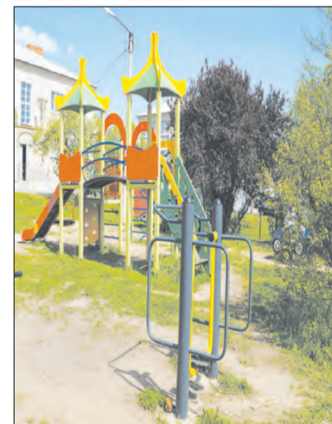
Помогла местная инициатива