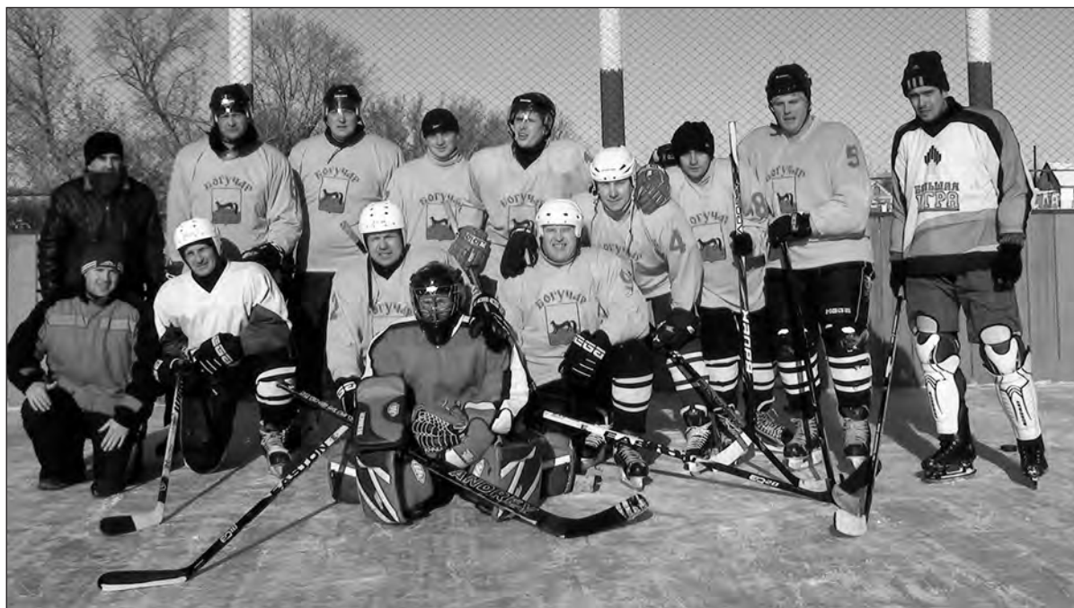
Богучарская ледовая дружина