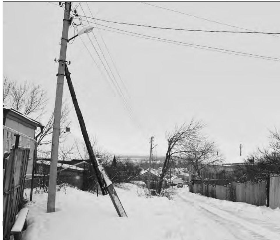
■ Вопрос по освещению переулка Нагорный обещают решить

– По вопросу давались разъяснения на собрании улочкомов. Уборку твердых бытовых отходов в данной части города осуществляет ИП Столпер. Ему сделано замечание, впредь не будут допускаться та-