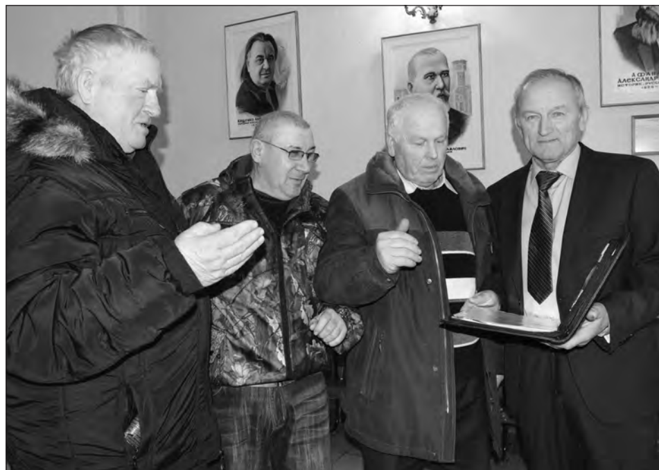
■ Твердохлебовцы подняли вопросы газификации, телефонизации, строительства дороги и моста