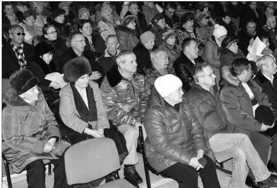
■ Желающих задать вопросы было много

– Программа формировалась на 30 лет. Берется такой срок, чтобы жители успели накопить деньги к моменту из-носа конструктивных элементов жилья. Если ввод в эксплуатацию домов воен-ного городка был в 1996 году, то ремонт