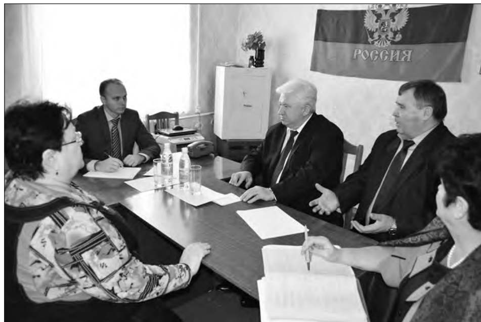
■ Каждому вопросу – максимум внимания