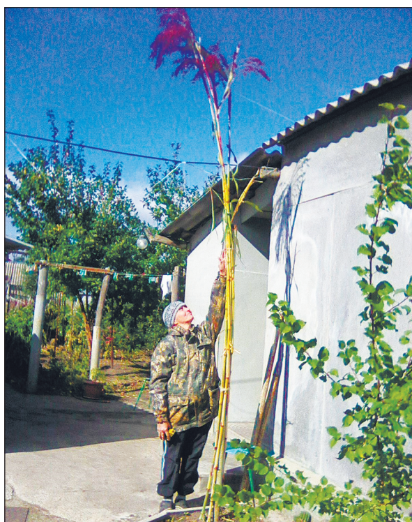
Растение-гигант во дворе жительницы Богучара

– Такой рост сорго спровоцировали благоприятные погодные условия и плодородная почва, – сказал главный агроном управления сельского хозяйства Богучарского района.