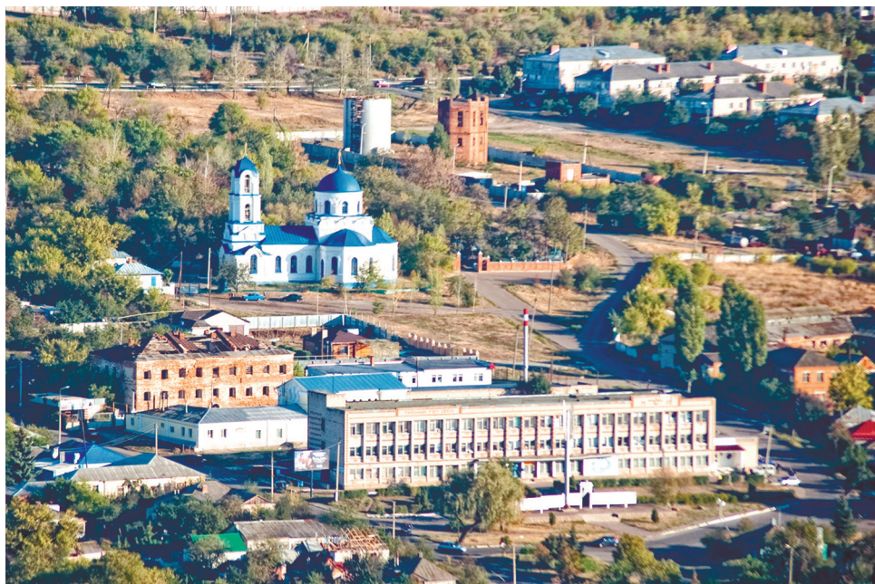
Красив Богучар с высоты птичьего полёта