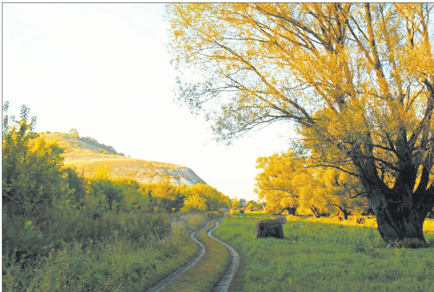
■ Когда едешь по этой дороге глазу открывается красивая картина