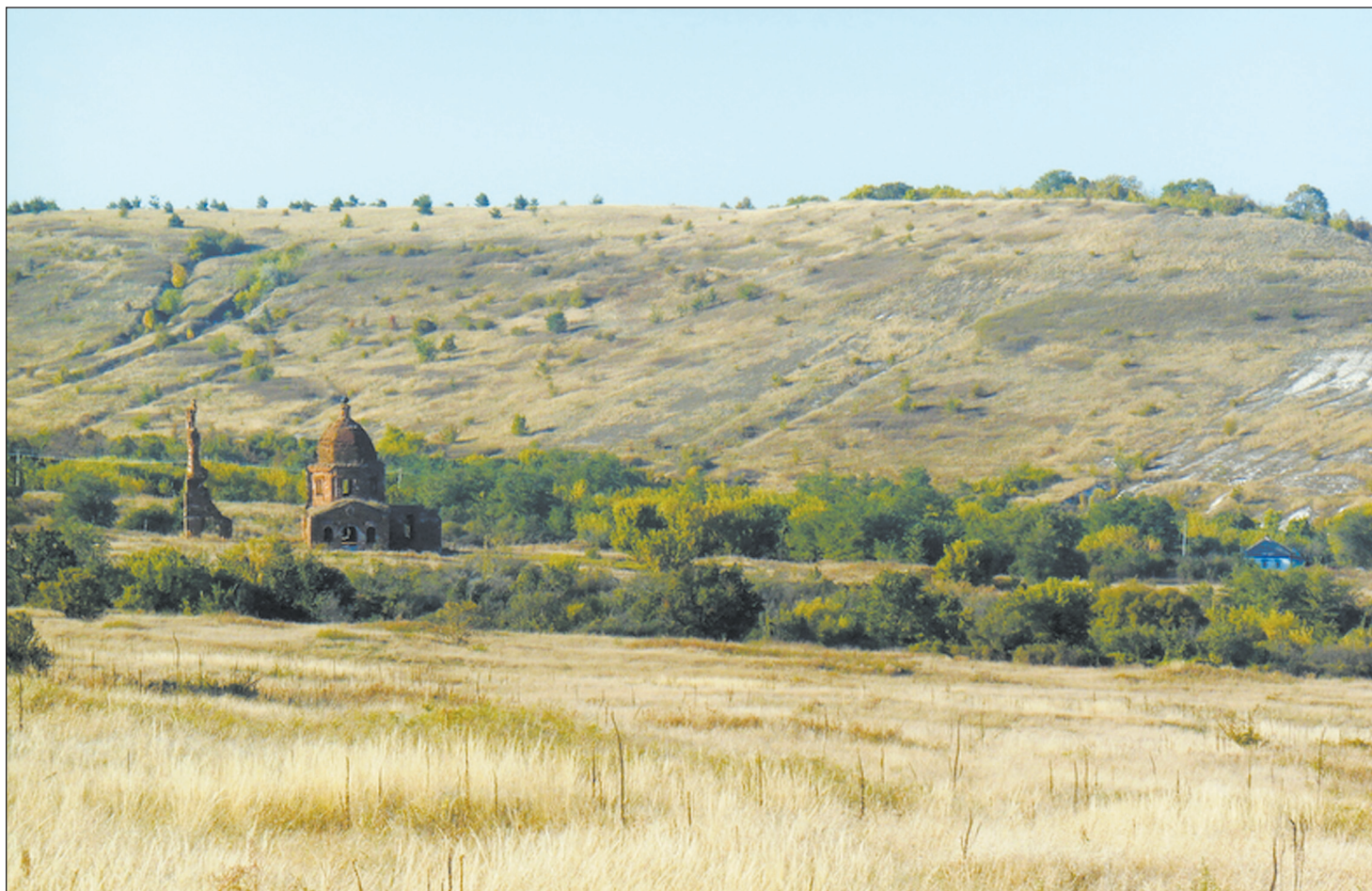
■ Храм – как напоминание об антирелигиозных временах