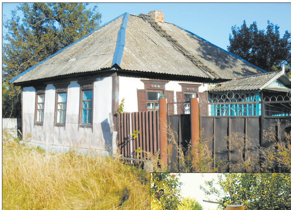
■ Увидеть такой домик уже редкость

го несколько. Сама она – жительница Богучара и приезжает сюда летом в опустевший родительский дом на несколько недель. По её словам, дома под дачи покупают в основном москвичи: ремонтируют их и приезжают отдыхать на одну-две недели, обычно летом.