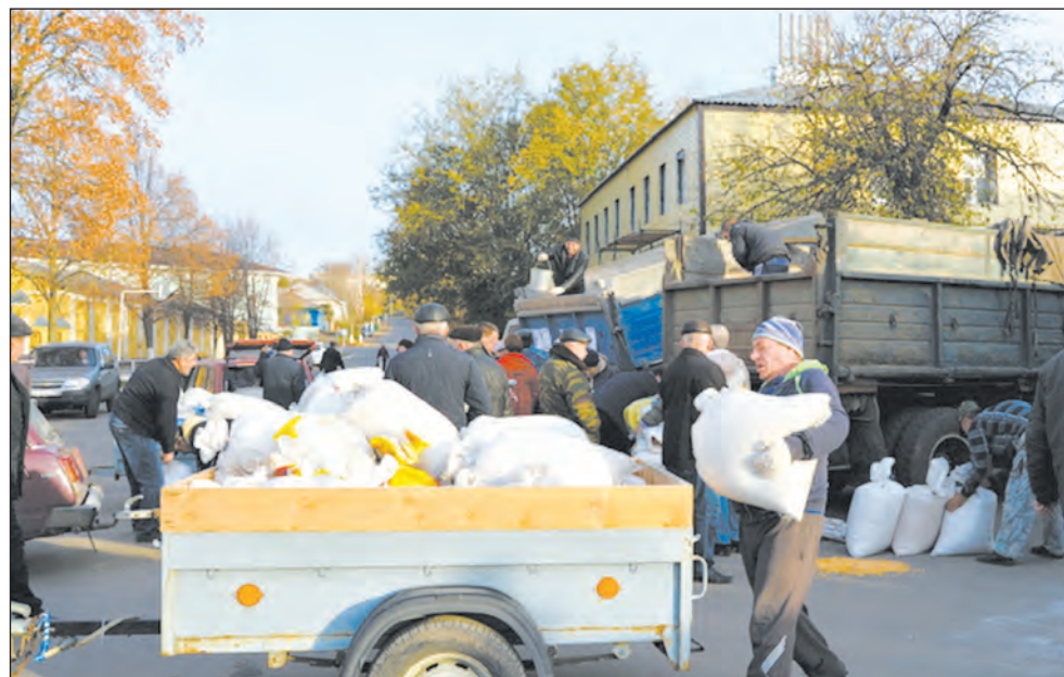
На ярмарке торговля шла бойко

торые будут вложены в эту отрасль, однозначно со временем окупятся. Да и нужно пытаться входить в различные федеральные и областные программы, в том числе и имеющие отношение к мелиорации. И мы нацеливаем на это наш агрокомплекс.