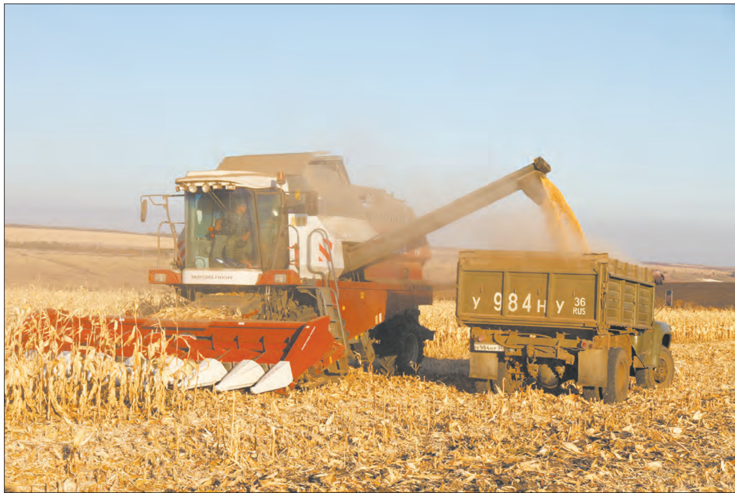
Идёт уборка кукурузы на зерно

– Конечно, специалистов-мелиораторов нужно возвращать на луга, сеноугодья. Финансовые затраты хозяйственников, ко-