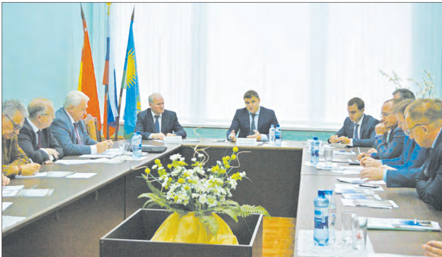
Разговор с главами районов проходил в конструктивном русле