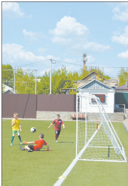
Будущее богучарского футбола