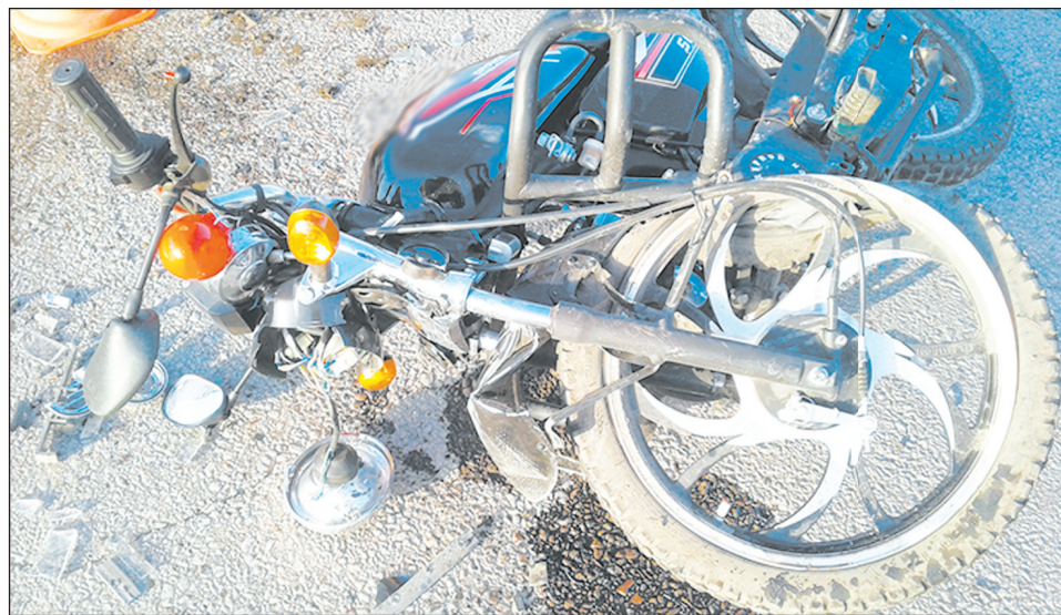
■ Немало аварий в районе происходит с участием двухколесного транспорта

– Причины, в основном, в халатном отношении к соблюдению Правил дорожного движения. Многие из тех, кто попал в аварии, либо не соблюдали скоростной режим, либо