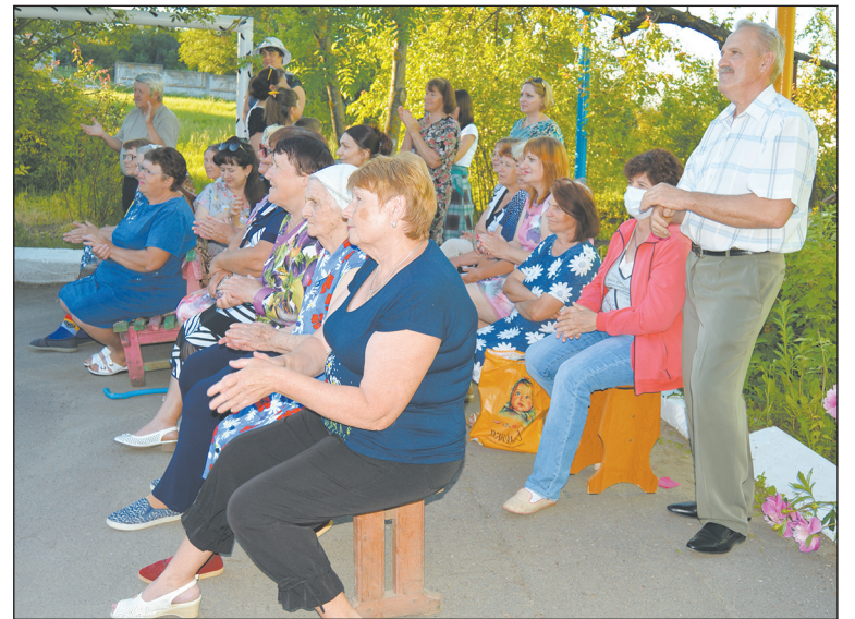
За каждый номер — аплодисменты

Пока шел концерт, жители беседовали между собой, обменивались мнениями, что-то обсуждали. Их дети и внуки танцевали под музыку и общались со сверстниками. А ведь именно так и налаживаются добрососедские отношения. Во время таких встреч и после них люди лучше понимают и чувствуют друг друга, находят общие интересы, стараются оказывать помощь и поддержку своим соседям. Беседа корреспондента «Сельской нови» с жильцами дома №11 показала, что такой