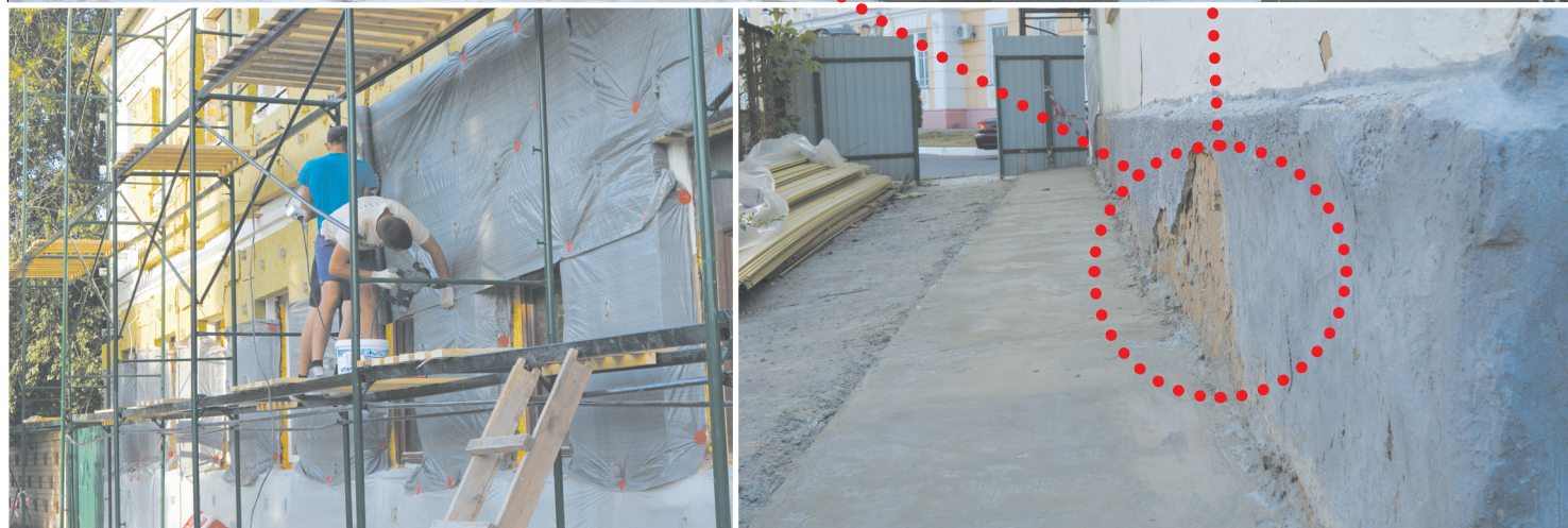
Отремонтированный дом теперь не узнать