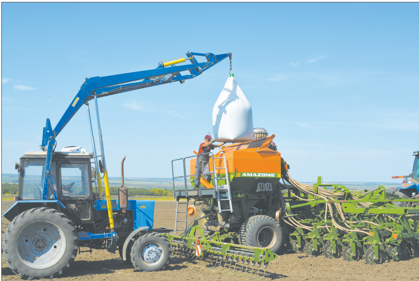
Посевной комплекс готовится к работе

Богучарским сельхозтоваропроизводителям показали, за счет чего можно добиваться высоких урожаев