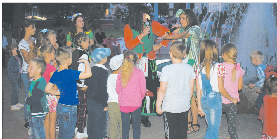
■ Начался праздник с детской программы

По окончании концертной программы всех желающих продолжить танцевальный вечер пригласили на молодежную дискотеку, которую открыла зажигательным флешмобом молодежь клуба «Импультс», а затем все танцевали под хиты