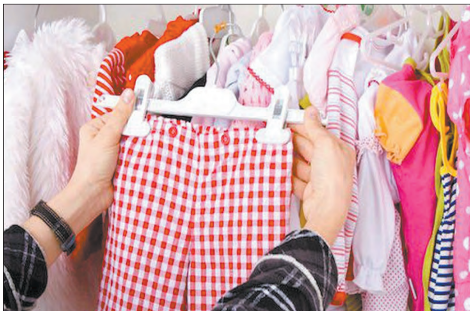
К выбору одежды для детей надо подходить очень тщательно

– Они установлены Техническим регламентом Таможенного Союза «О безопасности продукции, предназначенной для детей и подростков» 007/2011 и санитарным законодательством Российской Федерации. Степень безопасности изделий определяется гигиенической классификацией, основными элементами которой являются площадь непосредственного контакта с кожей, возраст ребенка и продолжительность непрерывной носки. Соответственно, чем меньше человеку лет, чем ближе к телу одежда и чем чаще и дольше она носится, тем более жесткие требования предъявляются к ней. Так к примеру, изделия для малышей должны быть изготовлены из натуральных материалов. Нельзя, чтобы внешние и декоративные элементы (кружева, шитье, аппликации и другие аналогичные элементы), выполненные из синтетических материалов, контактировали с кожей ребенка. Соединительные швы с обметыванием срезов в больших изделиях для новорожденных должны быть выполнены на лицевую сторону.