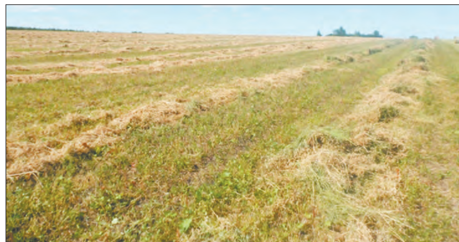
Сено пока лежит в валках

В связи с увеличением поголовья КРС ежегодно расширяются площади, отво-