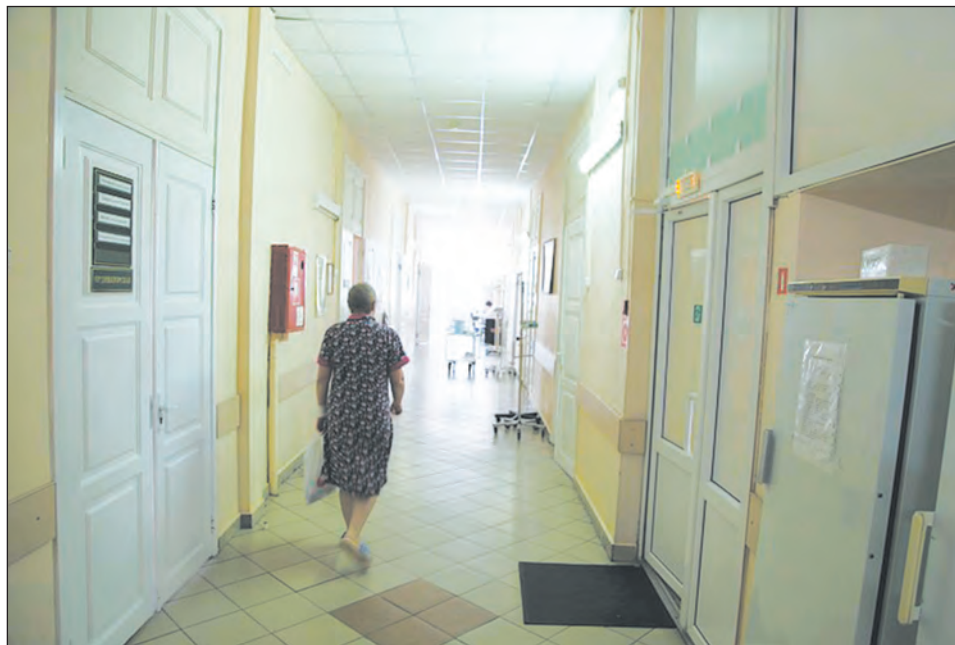
■ Каждый раковый больной сможет получить медпомощь бесплатно