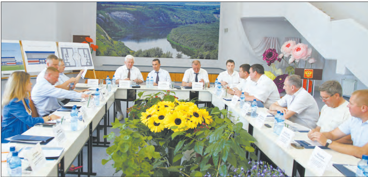
Идёт заседание комитета