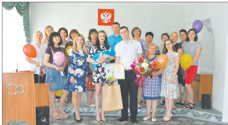
Фото с гостями праздника на память