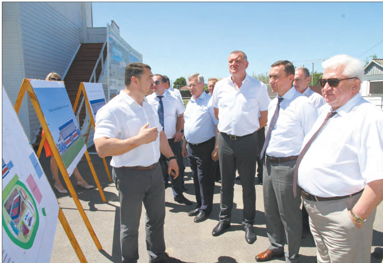
Участникам выездного заседания рассказали о завтрашнем дне спортивной жизни района

В нашем городе прошло заседание комитета облдумы по ФК и спорту