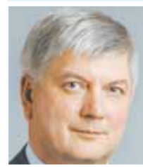
Александр ГУСЕВ, ВРИО Губернатора Воронежской области.

(На областном педагогическом совещании работников образования):