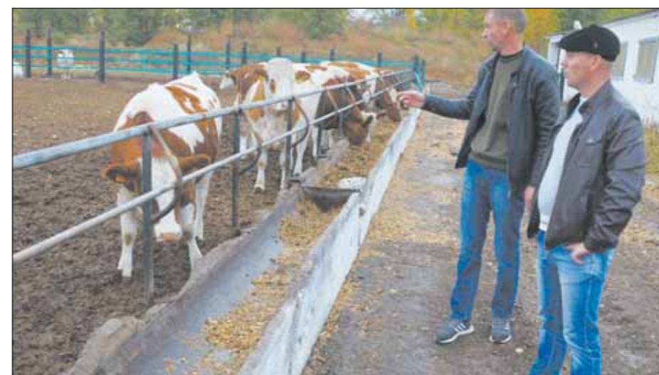
Богучарские фермеры – за экологически чистую продукцию

Сертификацией таких хозяйств на основании ГОСТов и технических регламентов в регионе будут занимать-