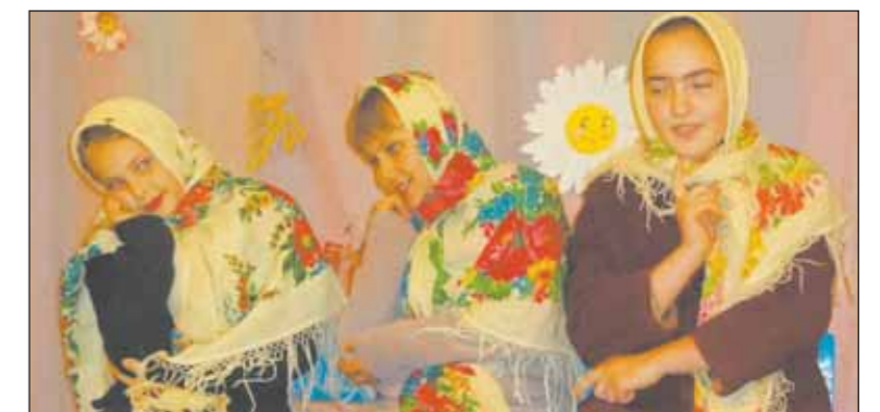
■ Каждый номер – гостям как подарок