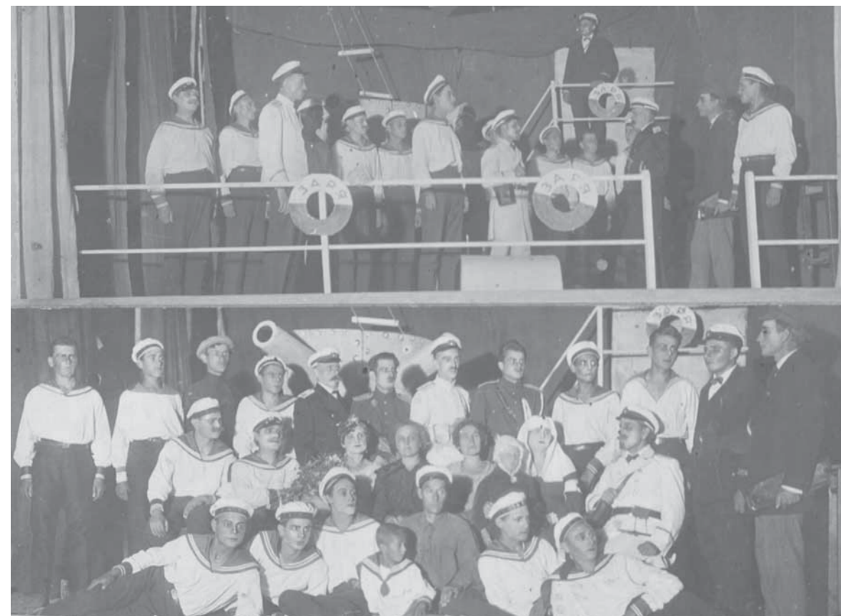
■ 1927 год. В «Народном доме» теперь кинотеатр. Силами худ.самодеятельности ставится спектакль «Разлом» про революцию на корабле в 1918 году.