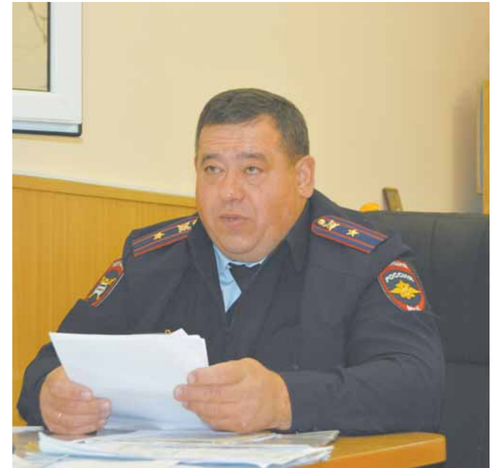
Старший инспектор дает комментарии по новому законодательству