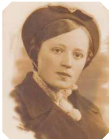
■ «Липчик от Людмилы. 20.06.41 г.»