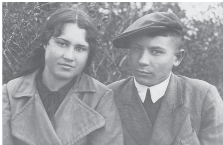
■ «18 лет, дручество, май 1942 года»