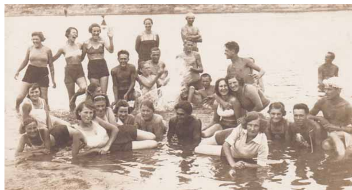
■ Фото сделано, по предположениям поисковиков, в 1939 году