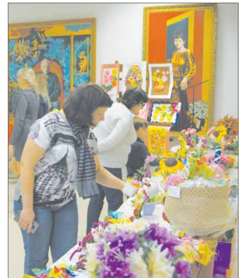
■ Морю фантазии можно было только удивляться