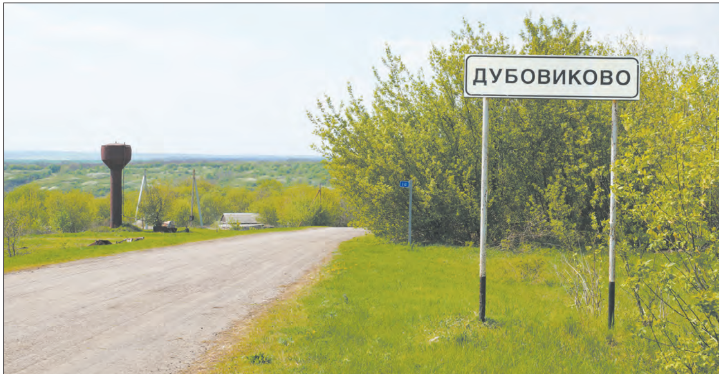
Въезд в село Дубовиково

На вопрос о том, есть ли в селе вода, наши новые знакомые ответили, что как таковой водопроводной воды нет. Раньше был колодец, но сейчас он превратился в мусорную яму, и пить воду из него нельзя. Каждый дом решает этот вопрос самостоятельно.