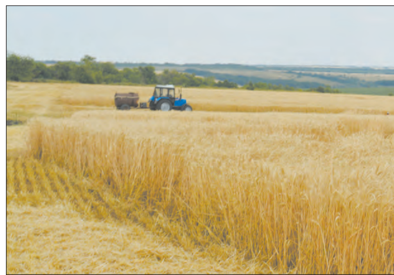
■ Теперь переработчики будут заниматься и растениеводством