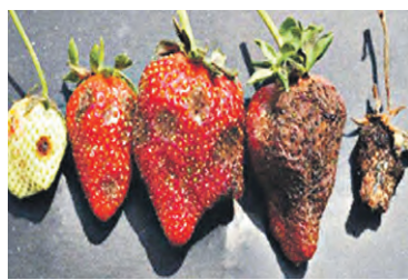
■ Так выглядят плоды и корневища растения, пораженного антракнозом

Одним из таких заболеваний является черная пятнистость, или антракноз земляники, вызываемый патогенным грибом Colletotrichum acutatum Simmonds. Возбудитель