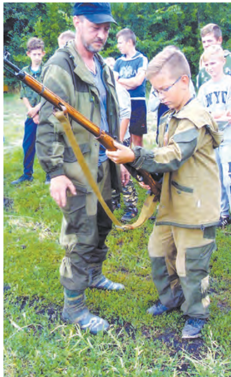
■ Мастер-класс по стрельбе

По традиции отдыхающие побывали на экскурсии в Дубравском музее. Посетили дети и каменную гору, расположенную слева от дороги на Монастырщину. Ребятам показали пещеру, в которой в годы ВОВ стояли фашисты, и место заброшенной скважины минеральной воды.