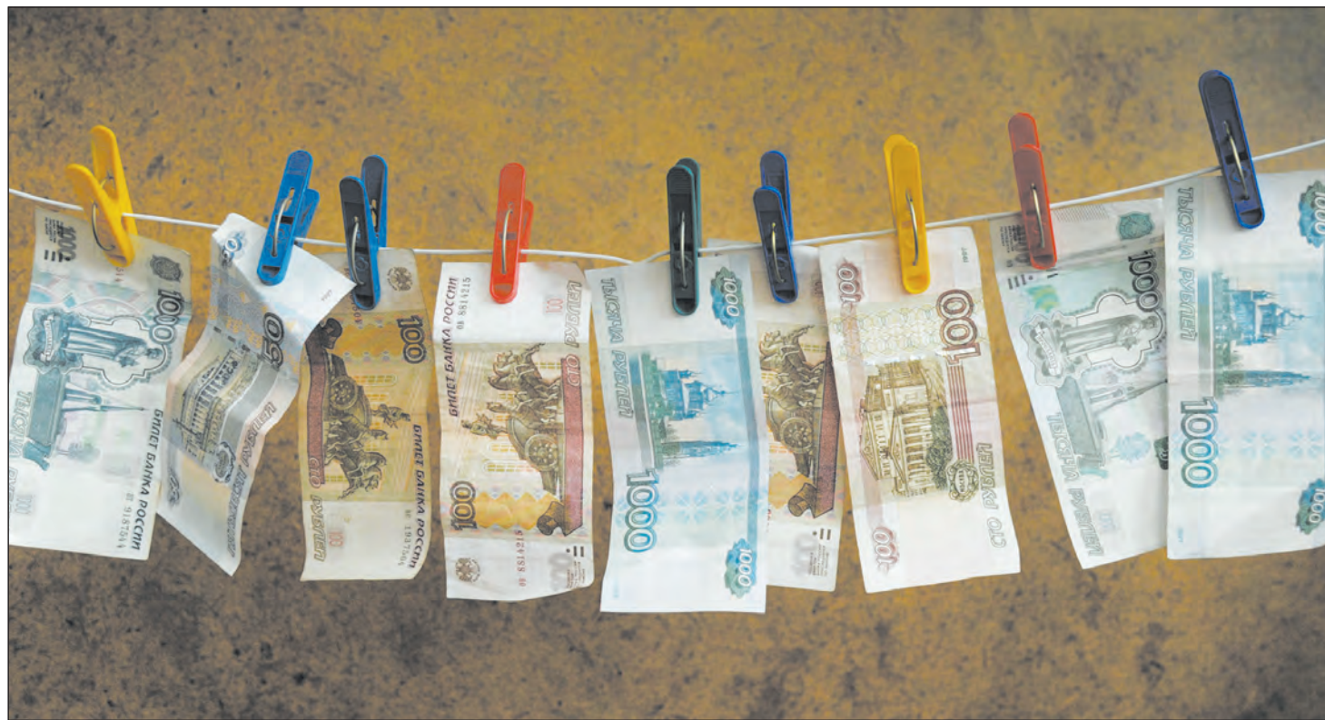
В рыночной экономике государство цены не регулирует

Все, что вы хотели знать об инфляции, но не знали, у кого спросить