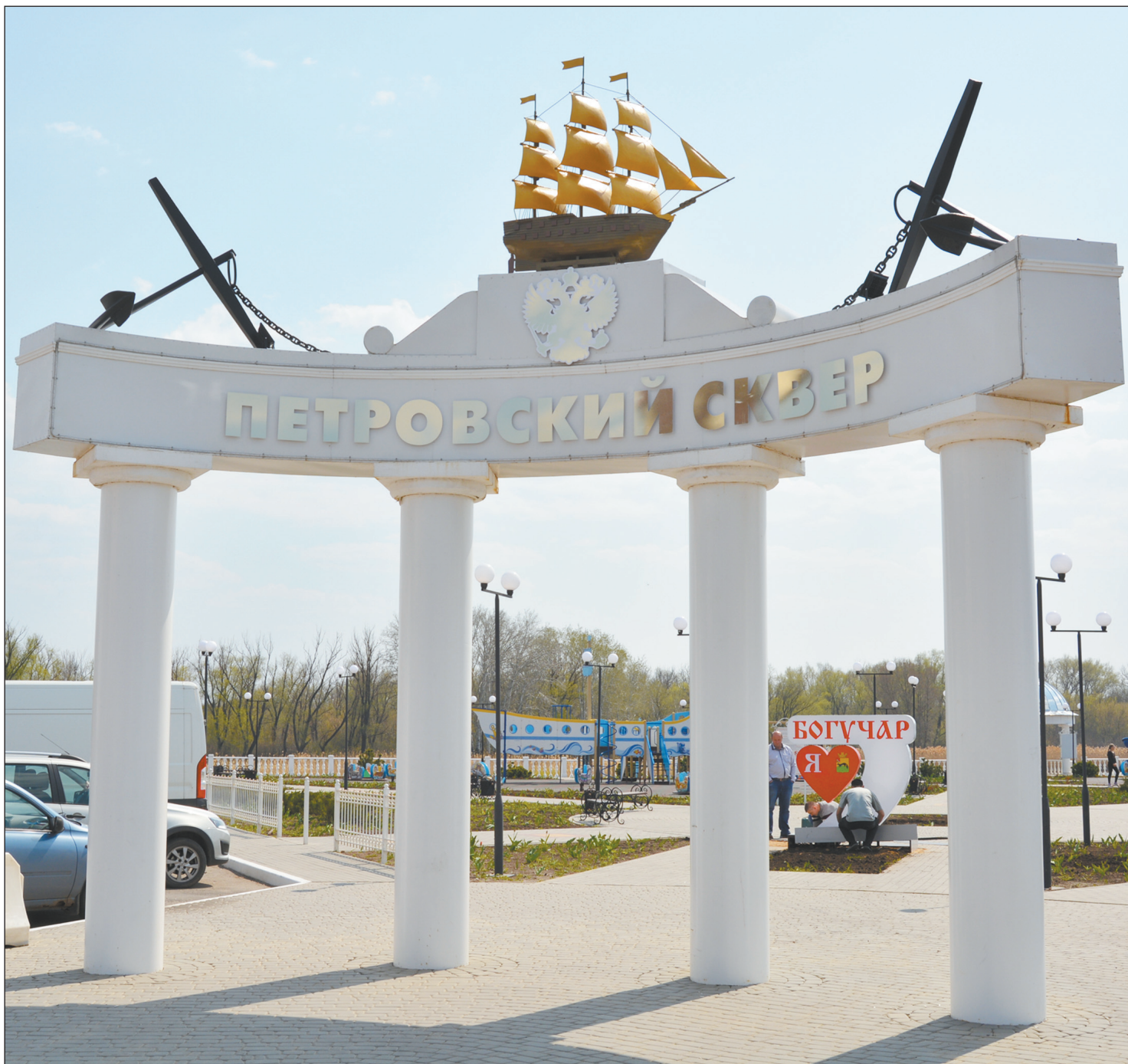
Кованый парусник дополнил входную группу Петровского сквера

Набережную украсило изделие кузнецов из Воробьевского района