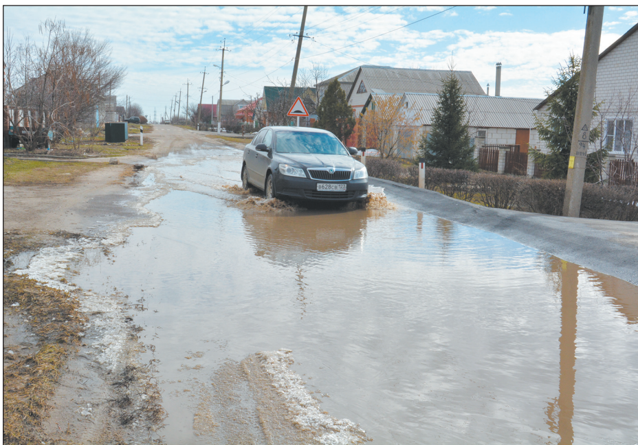
Вода скапливается здесь весной, после таяния снега, и летом, после дождя