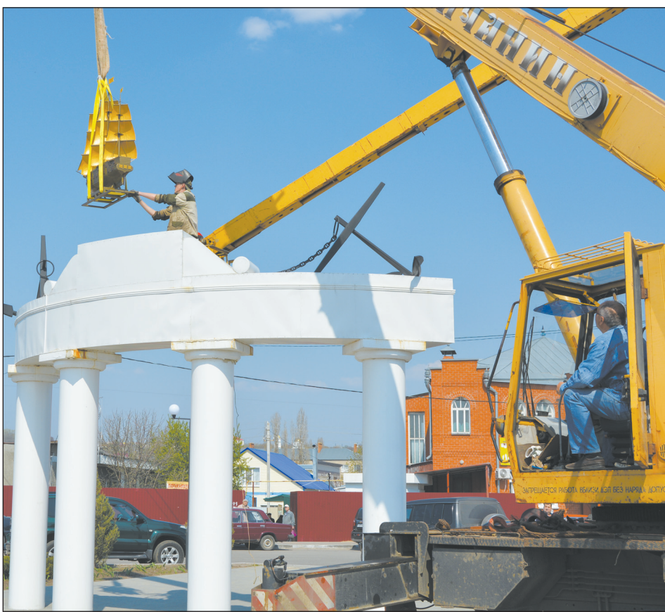
Макет корабля устанавливали два часа