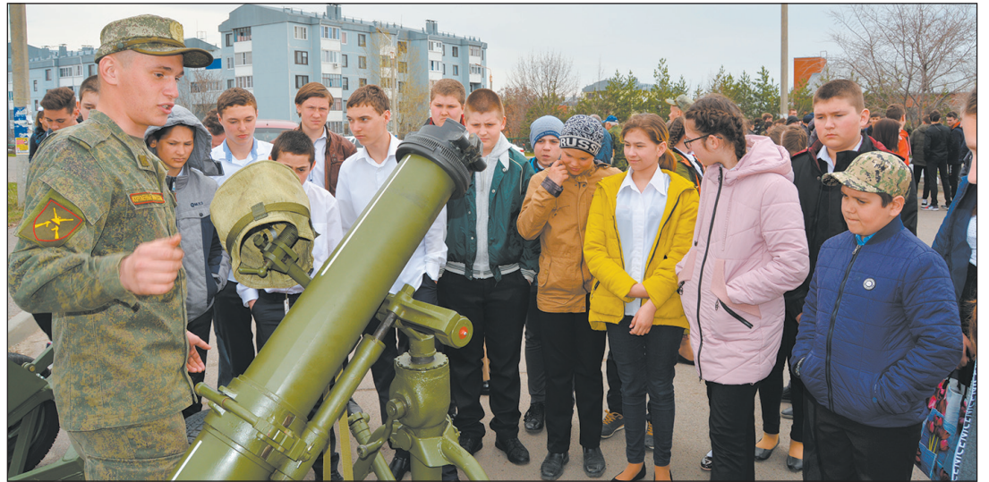
Солдат рассказывает школьникам о боевых характеристиках миномета

ИМЕЮТСЯ ПРОТИВОПОКАЗАНИЯ. НЕОБХОДИМА КОНСУЛЬТАЦИЯ СПЕЦИАЛИСТА