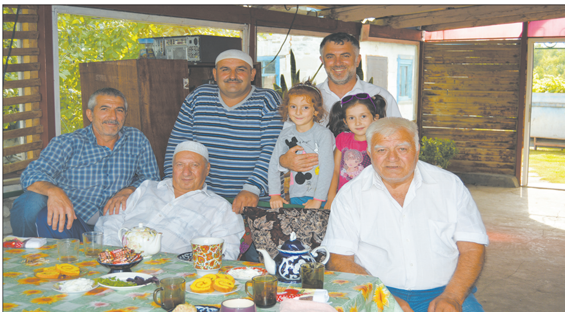
■ Как хорошо сидится за ароматным чаем с восточными сладостями

Всем нашли работу – одним в поле, другим на ферме, среди них оказались даже специалисты газовой службы. В совхозе «Первомайский» начали тогда проводить газификацию, природный газ провели из Ростовской области.