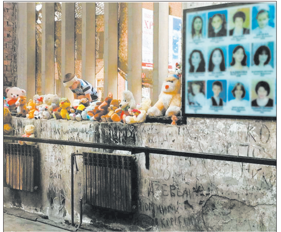
На мемориале всегда лежат детские игрушки

Эти страшные события со многими жертвами повысили активность антитеррористических организаций. Благодаря поддержке государства предупреждает-