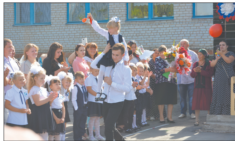
■ Первый звонок для учеников Лофицкой школы