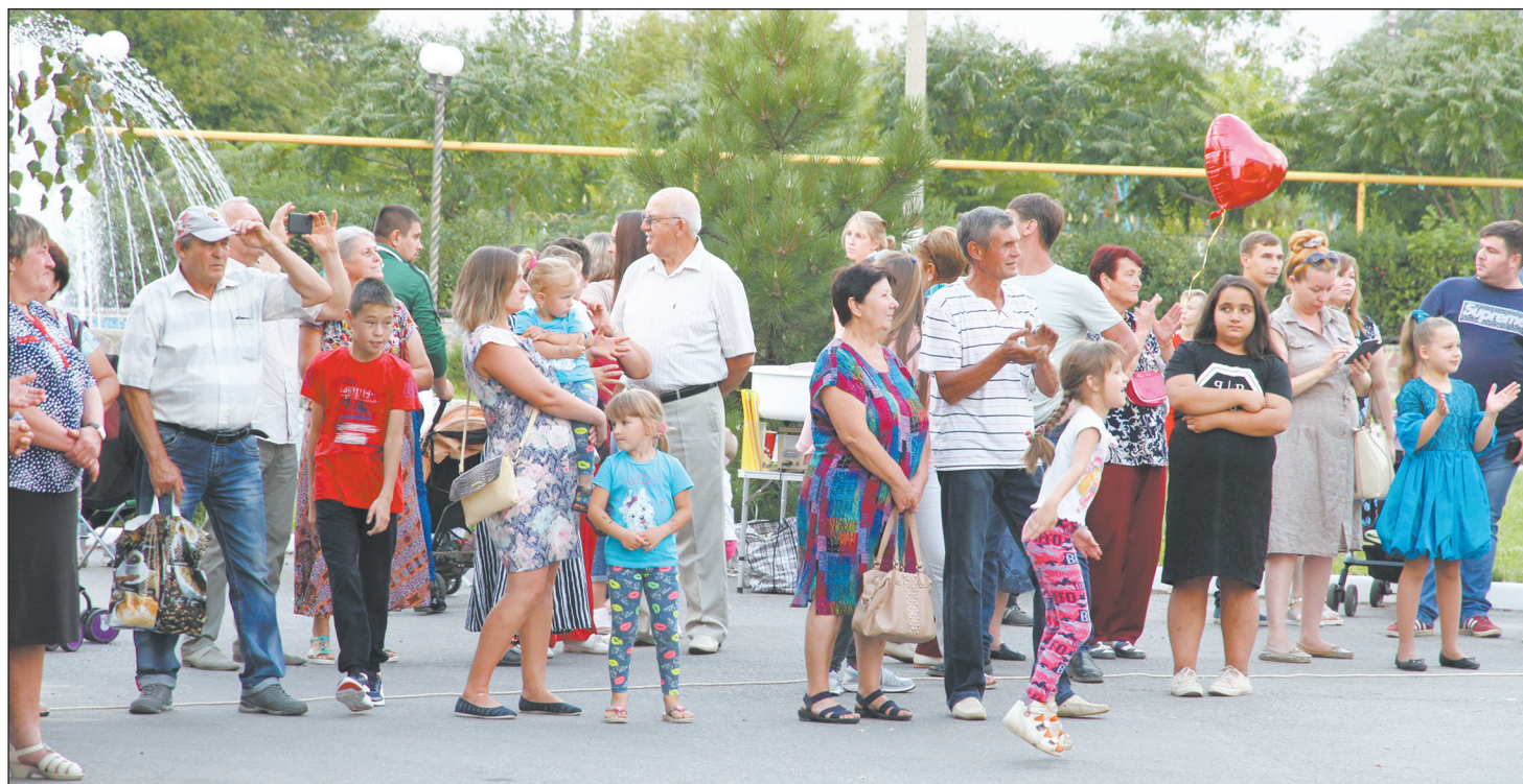
■ На сельский праздник в Данцевку приехали больше 100 человек

На сельское торжество в Данцевку приехали юные спортсмены из Павловска