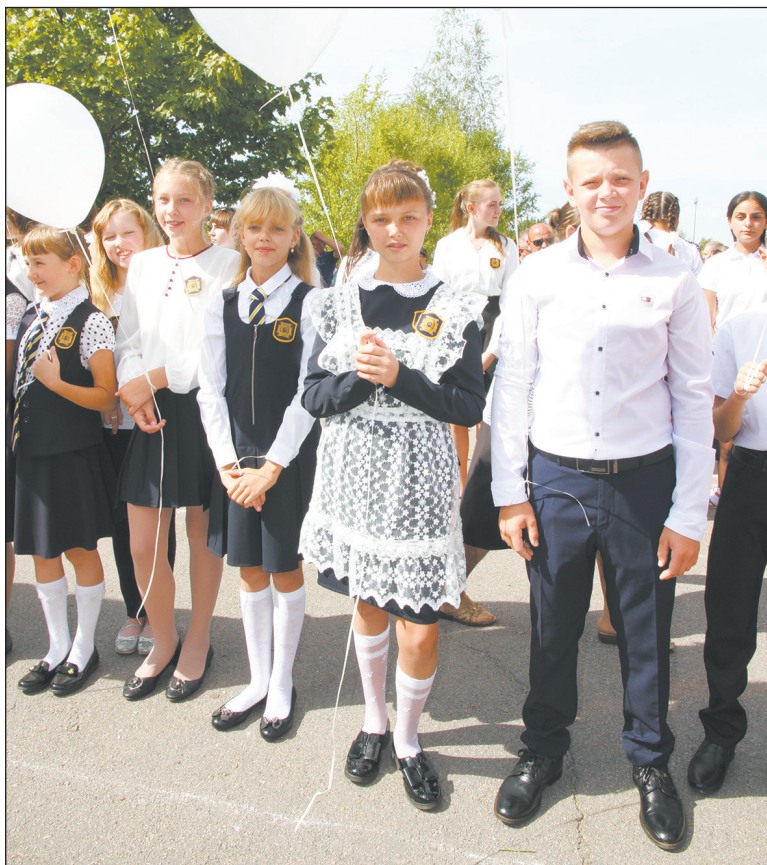
■ Богучарский лицей пополнился новыми учащимися