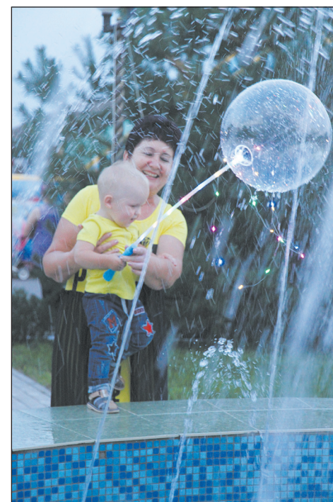
■ Данцевский фонтан привлекал гостей

«Олимп», которые впервые приехали в Данцевку. Девочки в возрасте от семи до 15 лет продемонстрировали акробатические номера верхом на лошади, движущейся по кругу под динамичную музыку. Восхищенные бесстрашием павловчанок жители Данцевки сопровождали каждый выполняемый маневр бурными аплодисментами.