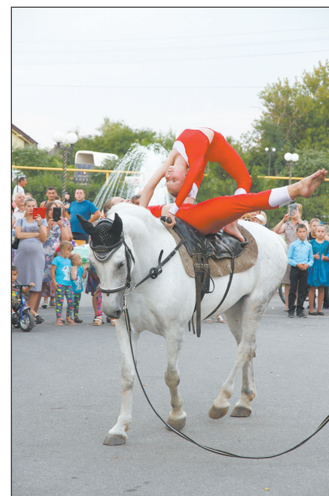
■ Парные упражнения на лошади

Еще одним подарком стало уникальное выступление юных воспитанниц павловского детского конноспортивного клуба