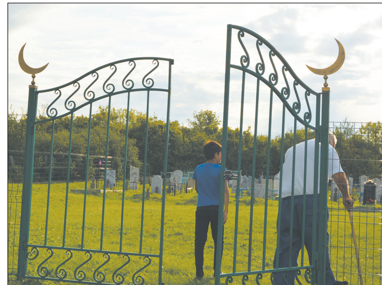
■ Вход на мусульманское кладбище