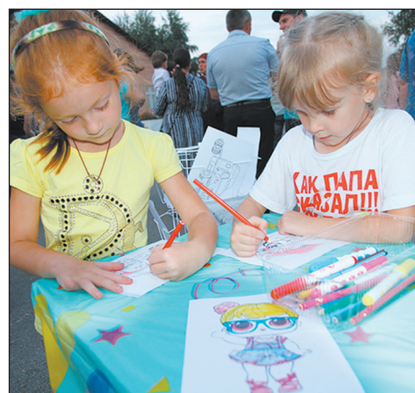
■ Развлечение для детворы