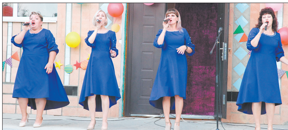
■ Пели самодельные артисты из Луговского поселения