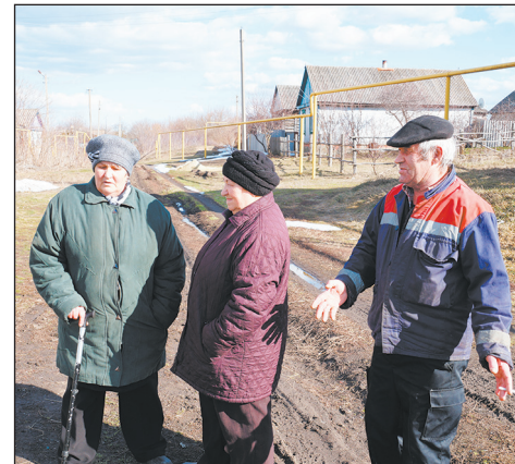
Монастырщинцы возмущены отсутствием дороги

— Все дороги в поселении ремонтируются постепенно, сделать их сразу не