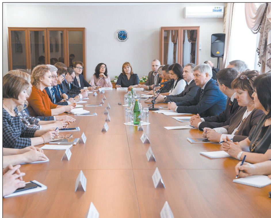
Встреча прошла в доверительной атмосфере

Представители СМИ отметили: жители обеспокоены тем, что узких медицинских специалистов переводят в крупные больницы. Губернатор пояснил, что в предыдущие годы оптимизация медицинской сети была необходима из-за де-