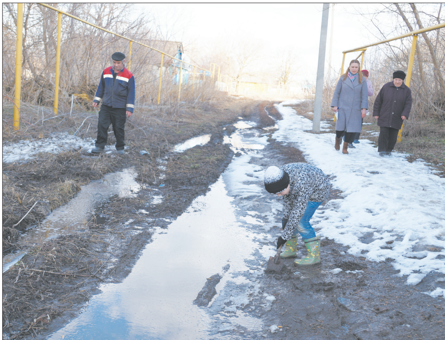
■ Эта лужа на улице Чапаева, по словам местных жителей, не пересыхает даже летом

Жители одной из улиц Монастырщины пожаловались на бездорожье