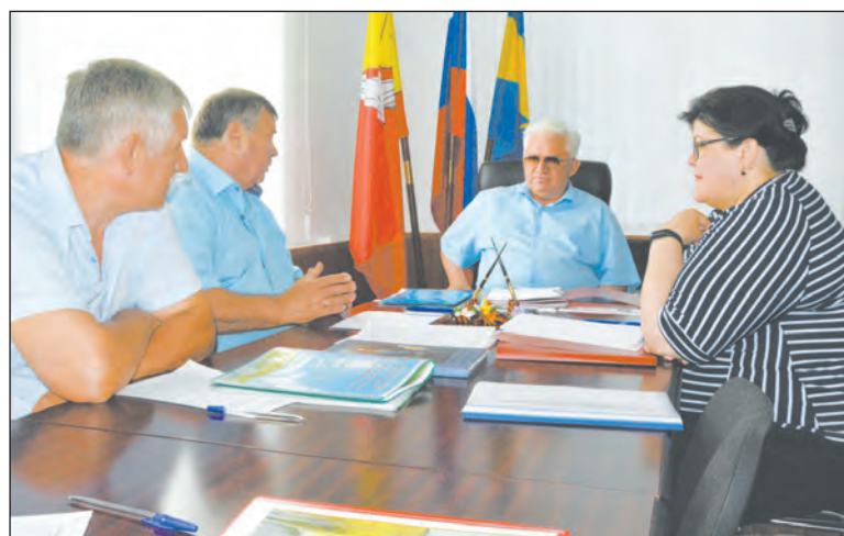
Идёт заседание оргкомитета