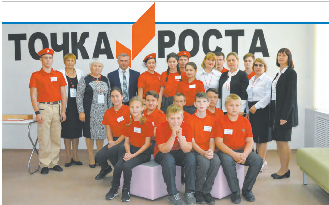
■ Фото на память с учениками и педагогами в открывшемся центре села Подколodновка