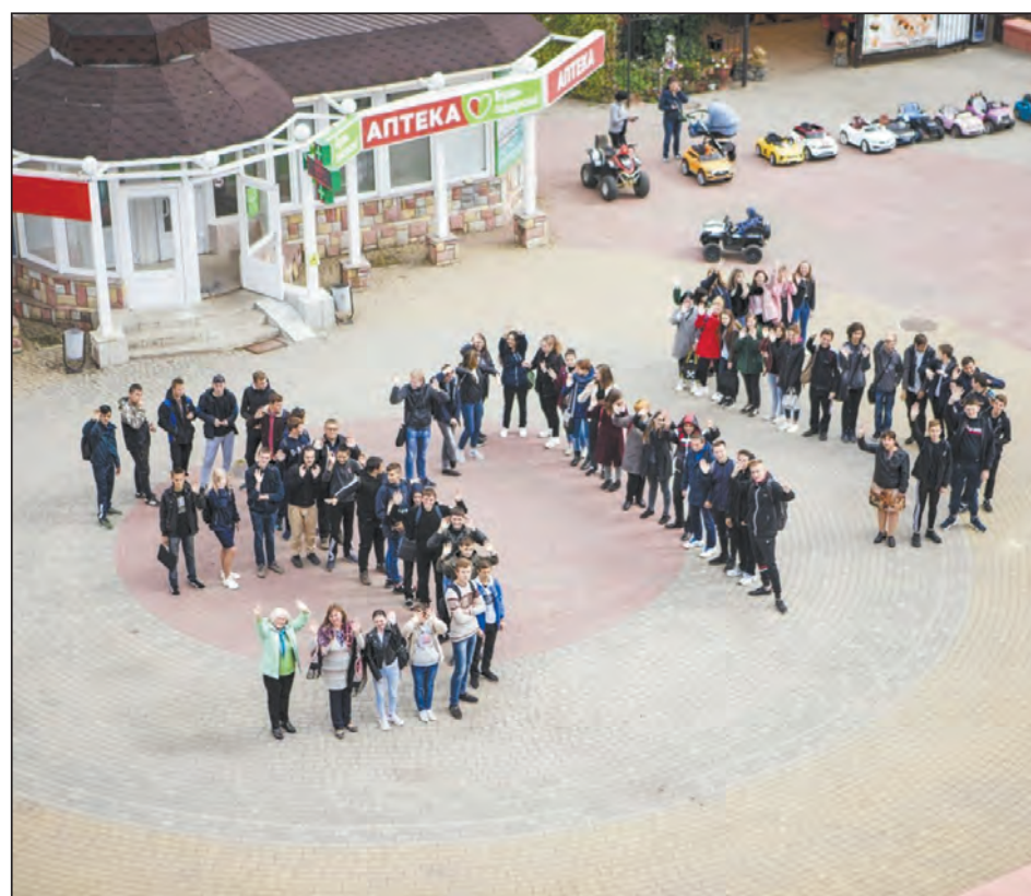
Богучарцы выстроились без тренировок за 20 минут