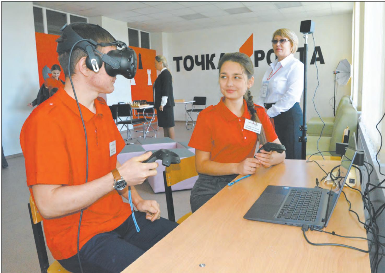
Центры оснащены новейшим оборудованием. Всего подобных открылось по области 63.

В двух школах открылись центры цифрового и гуманитарного профилей