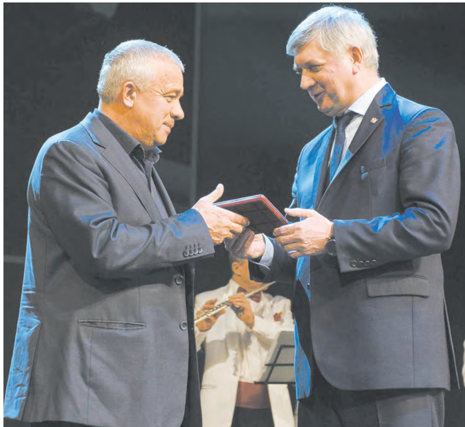
Награда из рук губернатора

Затем губернатор вручил медаль ордена «За заслуги перед Отечеством»