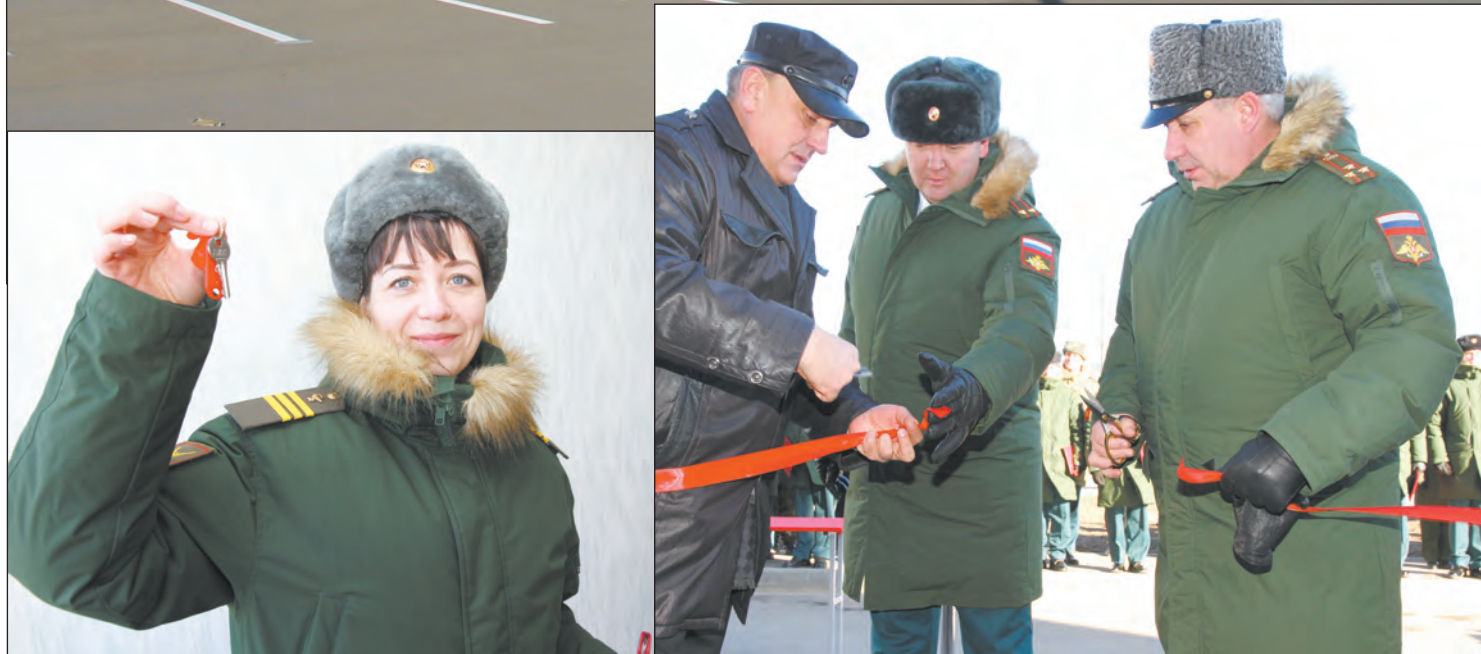
Новые многоэтажки и моменты торжества