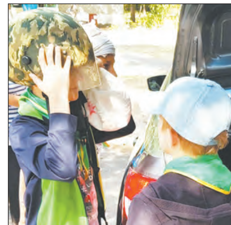
■ Примерка шлема росгвардейца

Наталья ЛИФИНЦЕВА