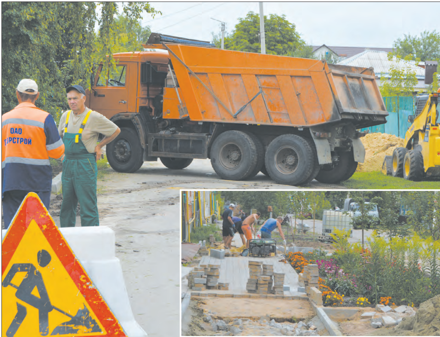
Одновременно с ремонтом дорог ведется обустройство тротуаров

Из областного и местного бюджетов выделено 80 млн рублей