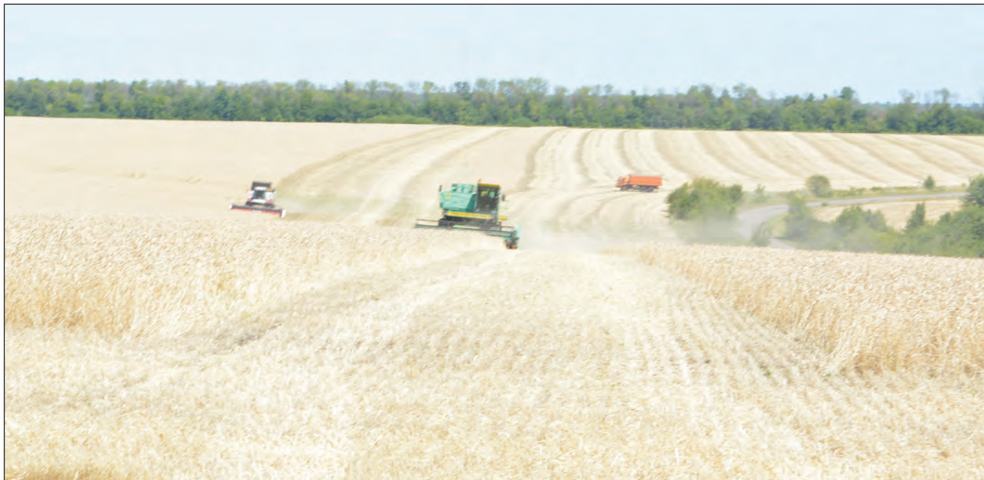
Идёт обмолот последних гектаров озимой пшеницы