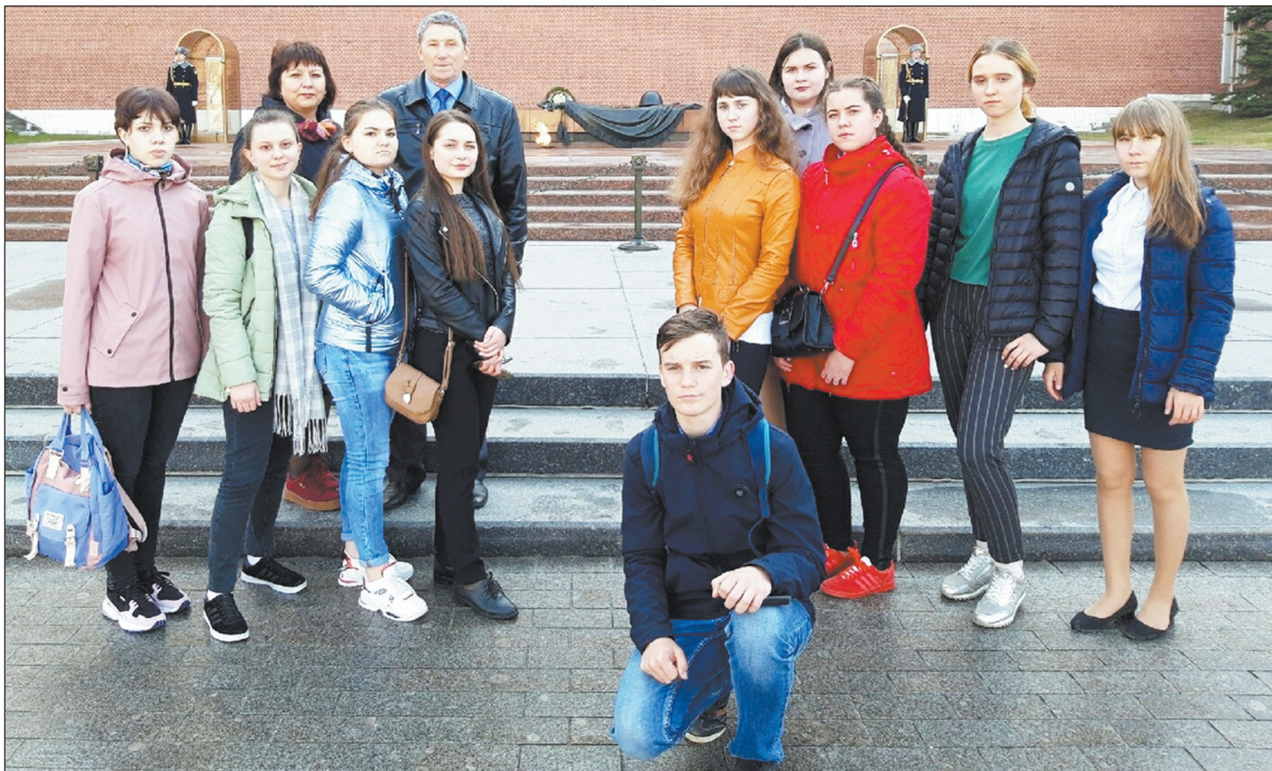
Участники поездки у Вечного огня на Могиле Неизвестного Солдата