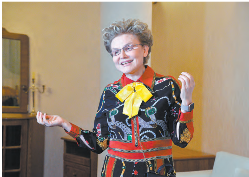
Елена Малышева в передачах поднимает разные темы

– Моя основная профессия – терапевт. Любой врач в состоянии объяснить человеку, как правильно питаться, чтобы иметь нормальный вес. На 80% вес зависит от того, как вы питаетесь, и вся теория его снижения сводится к трем пунктам. Первое: чтобы худеть, надо есть! Вы должны есть четыре, пять или шесть раз в день. Голодание, ограничительные диеты признаны худшими системами пищевого поведения в мире. Сегодня у нас есть анализ 47 мировых диет, и очень четко в худшую группу попали ограничительные диеты: белковая, диета Аткинса, диета Дюкана – они на самом последнем месте. А самой лучшей является средиземноморская диета. Второе: секрет похудения – в одном стакане. Это значит, что объем съеденной за один раз пищи должен помещаться в стакан: 200-250 г – для женщин и 250-300 г – для мужчин. Третье: вода важнее, чем еда. В идеале нужно пить два литра воды в день, это десять