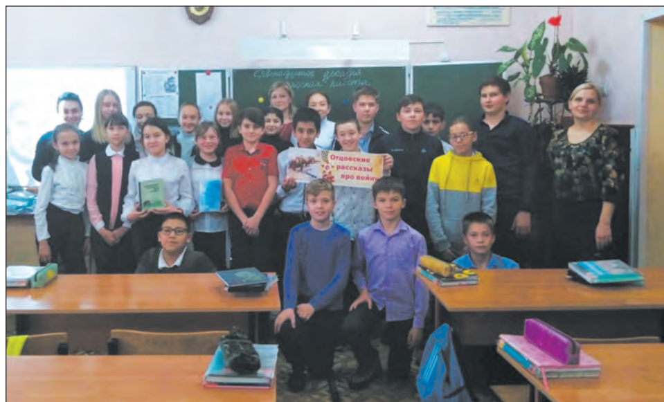
Ученики школы №1 на тематическом мероприятии в детской библиотеке

18 декабря сотрудники Дома народного творчества и ремесел совместно с