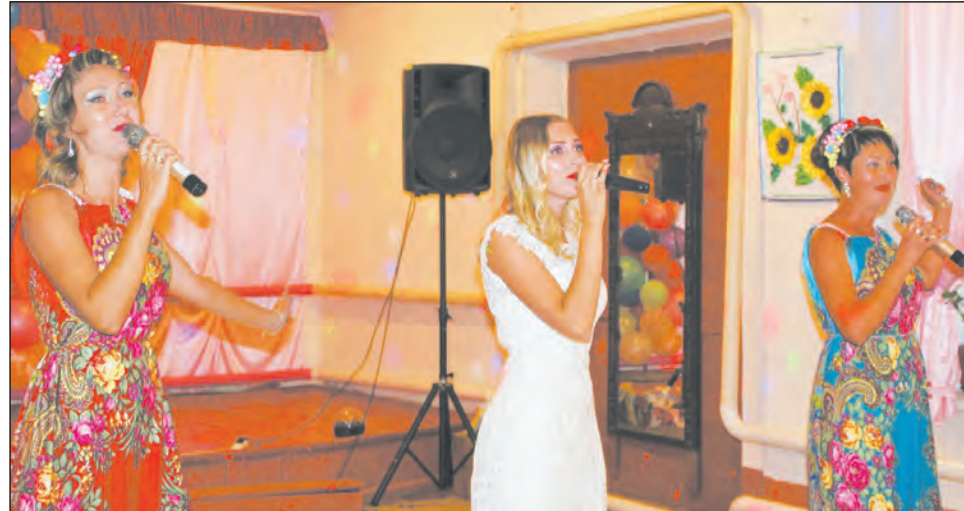
Душевная песня – в подарок