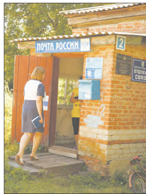
Вход в Шуриновское ОПС

Когда мы собирались возвращаться назад, в Богучар, жители Варваровки предложили заехать в отделение связи соседнего села — Шуриновки, и посмотреть, как обстоят дела там. Честно сказать, старенькое кирпичное здание, в котором находится местная почта, мы искали минут 20. Точное его месторасположение уточнили у прохожих. Оказалось, что мы несколько раз проехали мимо нужно-