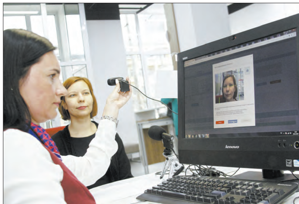
Биометрия: просто, удобно, быстро

– Проверка проходит следующим образом: гражданин записывает видео, где он произносит последовательность цифр. Это видео проверяется алгоритмами двух вендоров – отдельно изображение лица и голос. Параллельно система запускает проверку видео с помощью других биометрических алгоритмов. Если один или несколько из них не идентифицировал гражданина, то в работу включается так называемый модуль аномалий, который анализирует причины расхождений и в случае обнаружения мошеннических действий направляет соответствующее уведомление в банк, – пояснили в «Ростелеком», разработавшем систему.