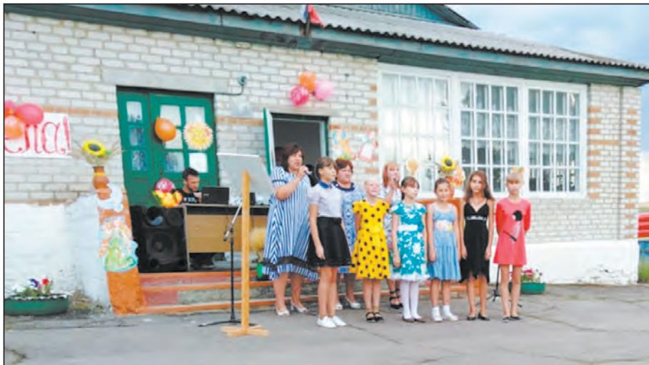
Односельчан поздравляют дети