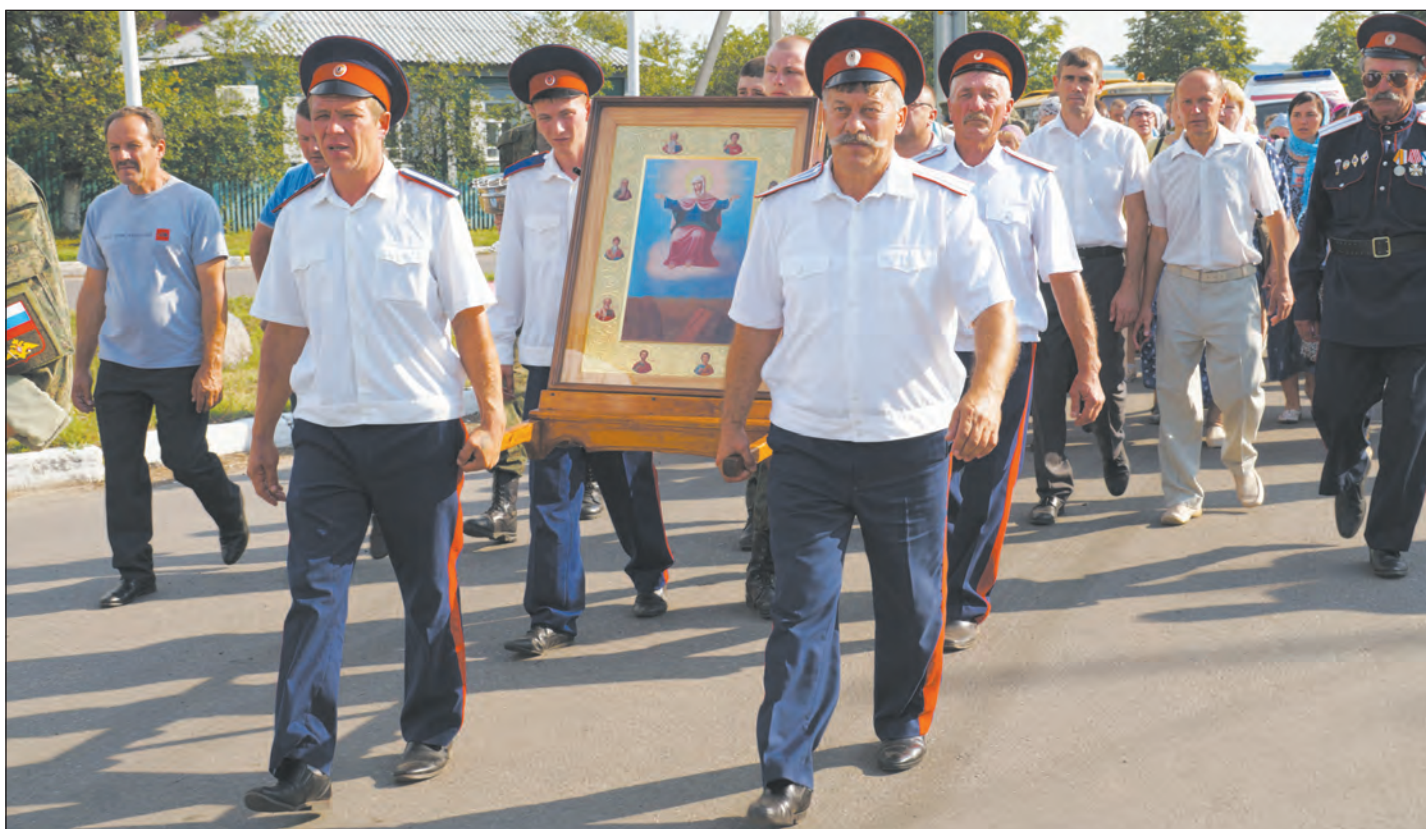
Крестный ход идет по Богучару