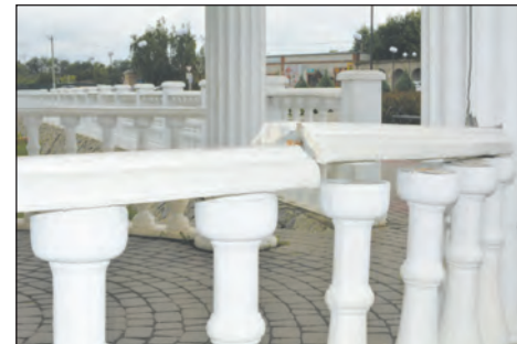
Теперь перила выглядят так

– К сожалению, люди не учатся на чужом примере. А очень хотелось бы, чтобы было иначе. Одних хулиганов находим, другие вредят, – отметил глава администрации города.