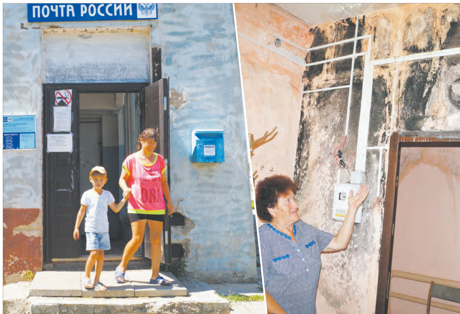
Несмотря на условия, отделение связи пользуется популярностью у местных жителей