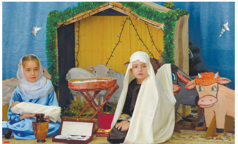
«Мария» и «Иосиф»