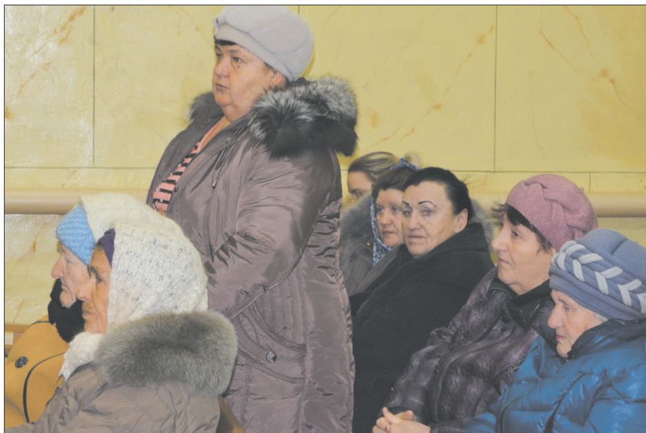
Участники встречи задают вопросы

ство сквера в селе Купянка». Документы уже готовы, стоимость проекта составляет 3309 тыс. рублей.