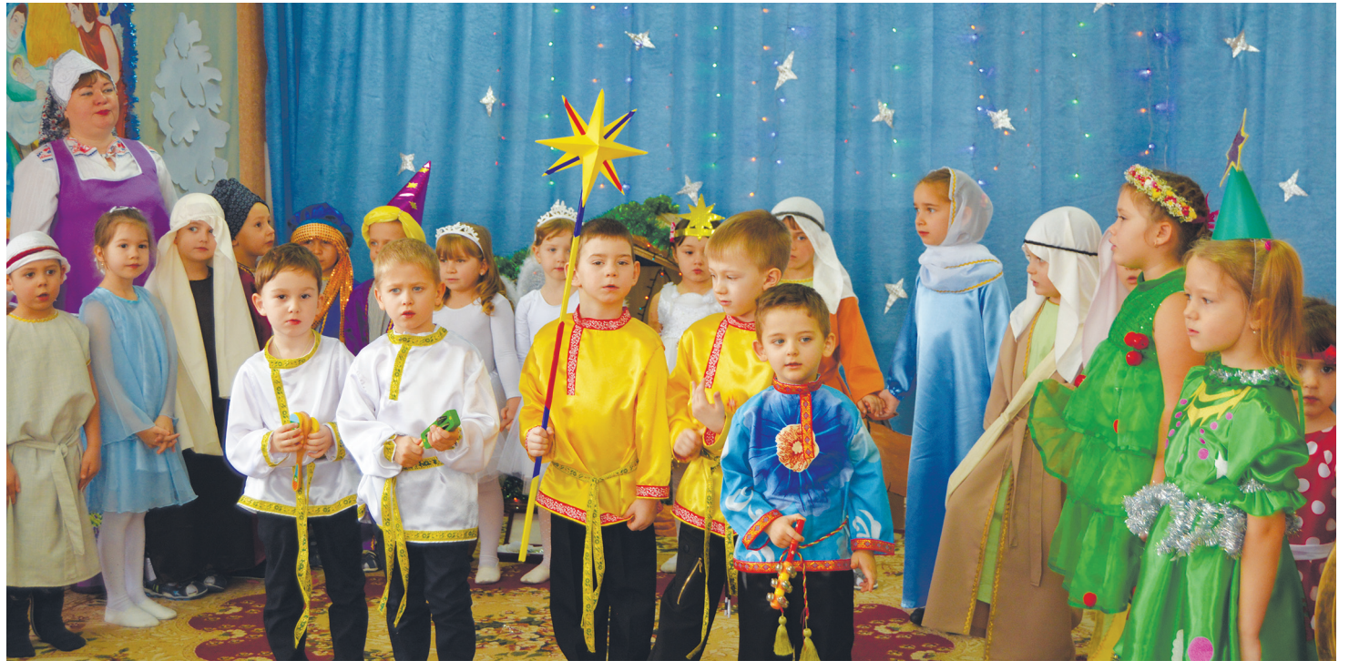
Дети исполняют рождественскую песню

В заключение этого мероприятия ведущая детским садом Ульяна Рыбьянцева попросила через газету поблаго-