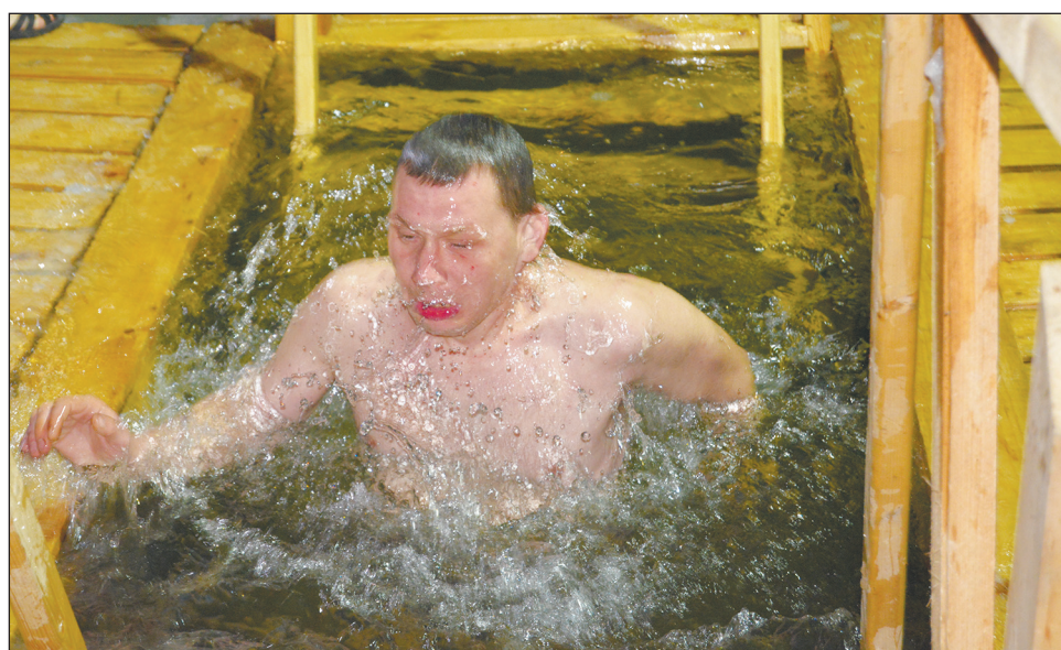
Ледяная вода только на пользу