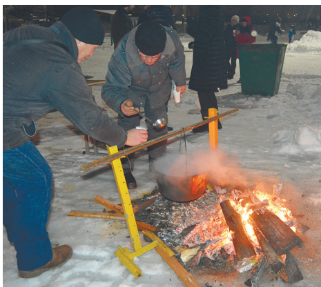
Кашу готовили на костре