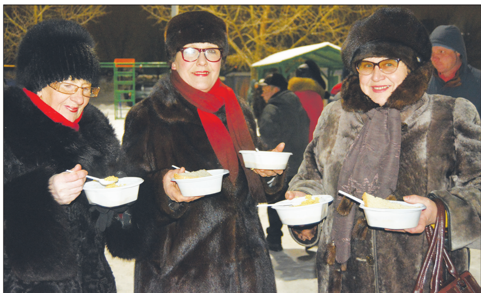
В крещенский сочельник в Богучаре угощали кашей